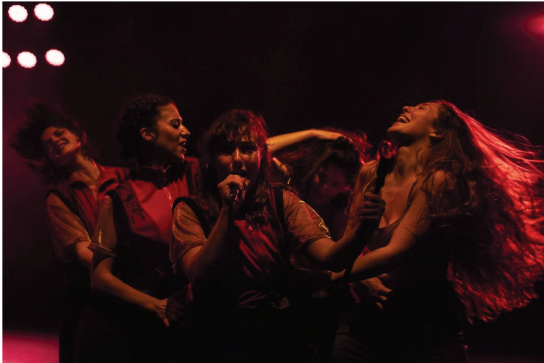
Mucha Muchacha llega al Central con una pieza homónima.

El colectivo Mucha Muchacha representa en el Teatro Central, espacio escénico de la Consejería de Cultura y Patrimonio Histórico, la obra homónima los días 4 y 5 de marzo en la sala principal; la mañana del domingo 6 completa su presencia en Sevilla con un taller de danza para 25 mujeres.