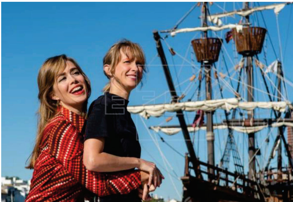
Las actrices y hermanas Greta (d) e Ingrid García Jonsson, en Sevilla.