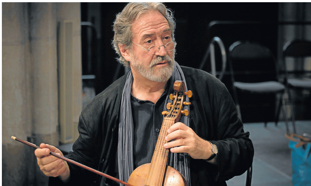
Jordi Savall será el gran protagonista del acto musical de apertura de la conmemoración del pintor.

El violagambista interpretará el día 28 junto a la Capella Real de Cataluña un gran concierto inspirado en la vida y la época del artista