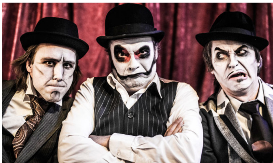
Imagen promocional de The Tiger Lillies.

DOLORES GUERRERO / SEVILLA / 17 NOV 2017 / 17:58 H - ACTUALIZADO: 17 NOV 2017 / 18:02 H.