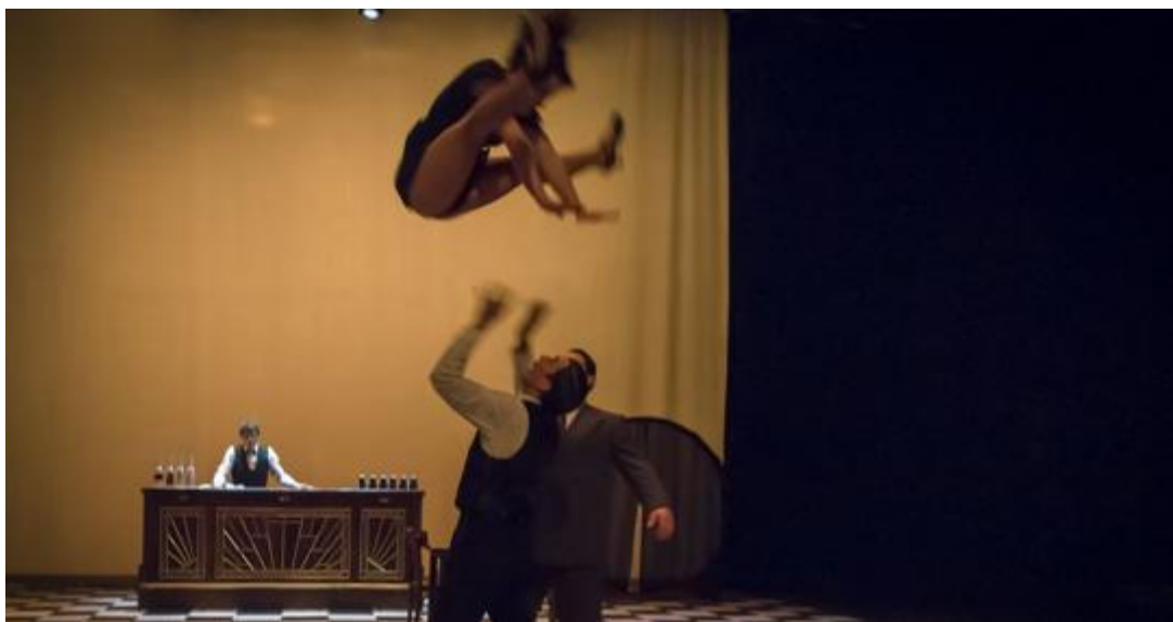
Imagen de la obra de The Rat Pack - RICHARD DENUL

Optimista y hermoso comienzo del año en el Central, con una sala llena que aplaudió en pie un montaje en el que muchos se dieron cuenta que el lenguaje del circo ha cambiado hace ya mucho tiempo.