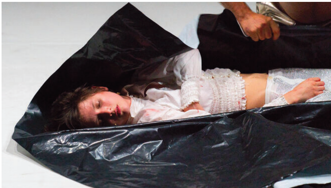
Una imagen del espectáculo de la Needcompany presentado en el Central.