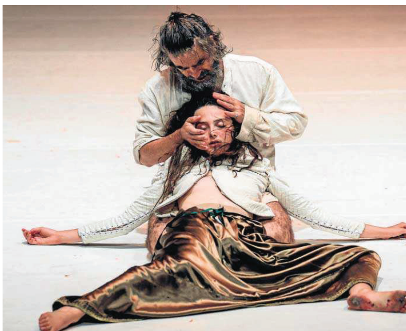
La propuesta de Needcompany ahonda en los entresijos de la violencia.

La mujer constituye el eje central sobre el que gira el resto de los personajes de la obra