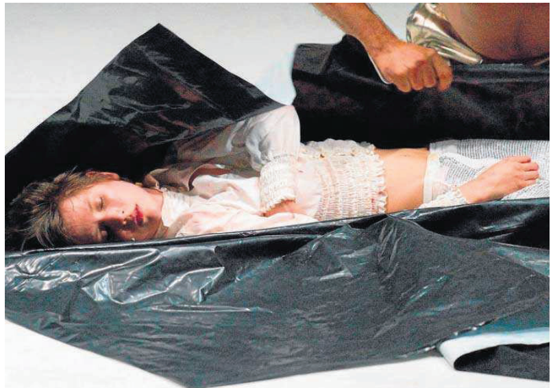
Una imagen del espectáculo de la Needcompany presentado en el Central.

De este modo, nos preguntamos por qué llamar Desdémona a una mujer a la que su marido mata por celos (¿cuántas llevamos en España este año?), Cordelia a una joven asfixiada por un padre demente, Ofelia –“la que el río no reñuvo”, que decía Müller– a una sui-