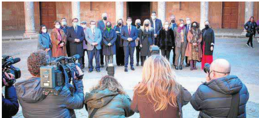
Fotógrafos immortalizan a los firmantes del protocolo ayer en el Palacio de Carlos V.