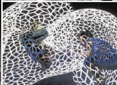
Algunas de las obras que se presentan, de «3 anunciaciones» a «Tras la escoba», pasando por «Mejor... es posible», «LÚ» y «El legado del león», en Los Remedios