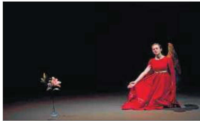
Un instante de '3 anunciaciones', de Pascal Rambert.

Sería imposible entender su proyección y la defensa acérrima de sus seguidores si no supiésemos ver destellos de genialidad en las propuestas de Pascal Rambert. Estas 3 anunciaciones con las que comienza la programación del Teatro Central del segundo año de la pandemia posee unas imágenes sublimes, unas interpretaciones inefables y una concepción de espectáculo donde todo el aparataje técnico produce una sana envidia de los pobres espa-