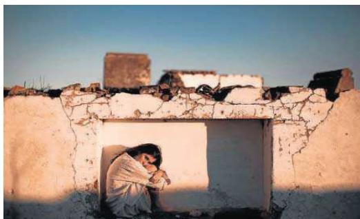
Silvia Pérez Cruz, en una imagen de su nuevo proyecto artístico.

La cantante, compositora y actriz Silvia Pérez Cruz ha llevado su música al teatro, la danza y el cine con frecuencia; ha interpretado canciones para películas de ficción y documentales, y ha utilizado la poesía como materia prima para sus composiciones: el espectáculo Grito pelao , con la