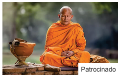
No tome ni un gramo más de cúrcuma antes de haber leído este...