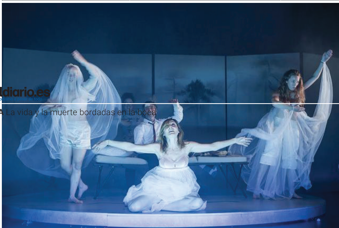
Escena de Sueño

El sábado 8 de julio arrancó la XXIII edición del Festival de Teatro y Danza Castillo de Niebla, y lo hizo con el espectáculo Sueño escrito y dirigido por Andrés Lima dentro del proyecto Teatro de La Ciudad. El proyecto que unió a tres de los directores más reconocidos del panorama teatral – Lima, Alfredo Sanzol y Miguel del Arco - comenzó poniendo su atención en la tragedia griega Ahora , se ha concentrado en la comedia shakespeariana y el resultado han sido dos espectáculos: este Sueño y La ternura de Alfredo Sanzol. Ambas se estrenaron en el Teatro de la Abadía esta primavera.