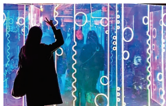
Así será el «laberinto de luz» en La Alameda de Hércules