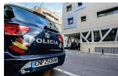
Detienen a un hombre por abandonar en un coche a una conocida...