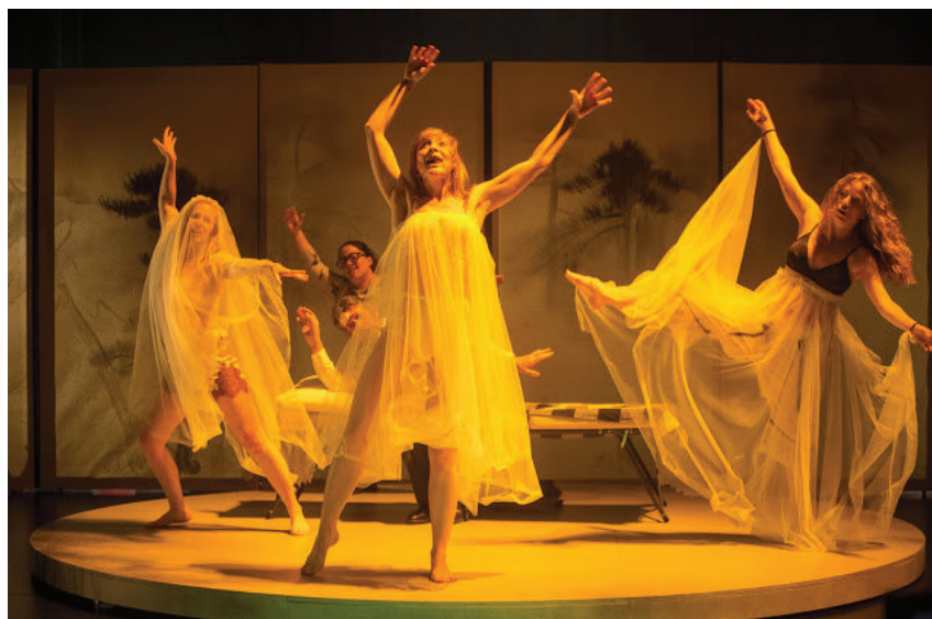
Un instante de Sueño

Con el punto de vista puesto en pasajes de la conocida obra de William Shakespeare El sueño de una noche de verano (que un servidor vio en escena gracias al montaje que realizó el maestro Miguel Narros y que estrenó precisamente en Sevilla en el año 2003 ) Lima vuelve al universo del célebre autor británico (tras propuestas tan estimulantes como Tito Andrónico o Los Mácbez ) para montar su obra más personal y, en una modesta opinión, más arriesgada.