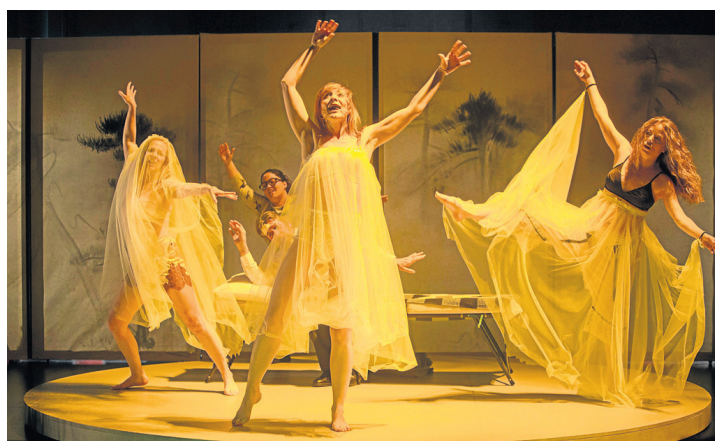
Un momento de la representación de este espectáculo.

El certamen se inaugura este viernes a las 18.30 horas con Errori , de Cañir Circo. Es un espectáculo de circo y acrobacias en el que acciones sencillas y cotidianas derivan en coreografías acrobáticas, excéntricas, con continuos golpes y caídas caóticas que contrastan con coreografías visuales de danza y malabar. ■