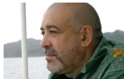
Muere un hombre tras ser agredido por llevar tirantes con la...