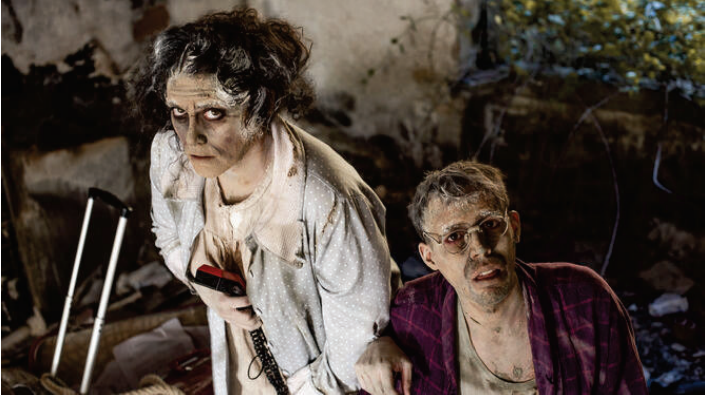
Una imagen de 'Dolores', la nueva obra de Teatro a la Plancha.