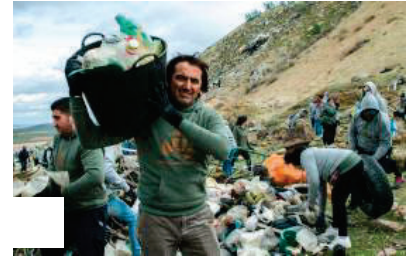
Retiran más de 30.000 kilos de residuos en La Quinta de Osuna