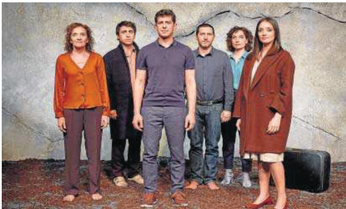
La compañía Teatro del Acantilado produce 'La geometría del trigo'.