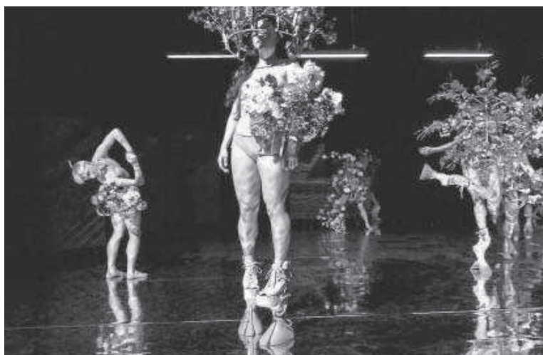
Intérpretes ataviados con el admirable vestuario de Romain Brau.

Soufflette es un espectáculo realizado por el coreógrafo francés François Chaignaud para la