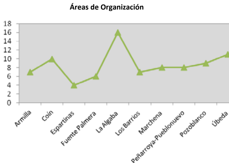
Cuadro nº 2

El promedio de áreas organizativas es de nueve. Ha de prestarse especial cuidado en aquellos casos, en que el número excesivo de áreas pueda conllevar unas necesidades mayores de personal para el desempeño de las competencias que tienen atribuidas.