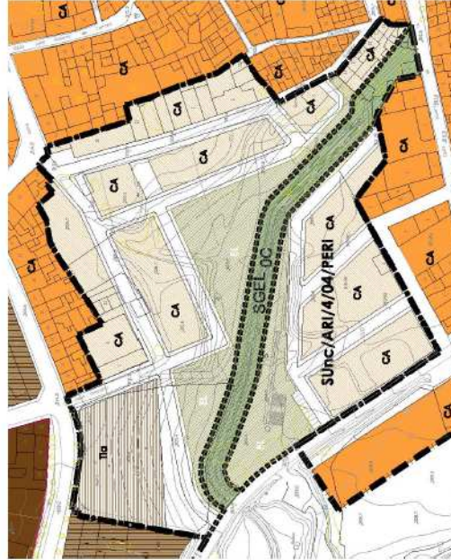
Ordenación detallada orientativa, a definir mediante un Plan Especial de Reforma Interior