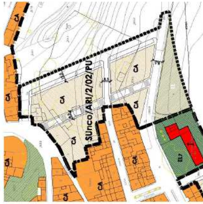
PLANO DE SITUACIÓN Y ORDENACIÓN DETALLADA