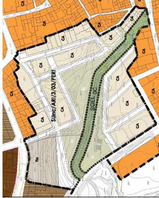
Ordenación detallada orientativa, a definir mediante un Plan Especial de Reforma Interior