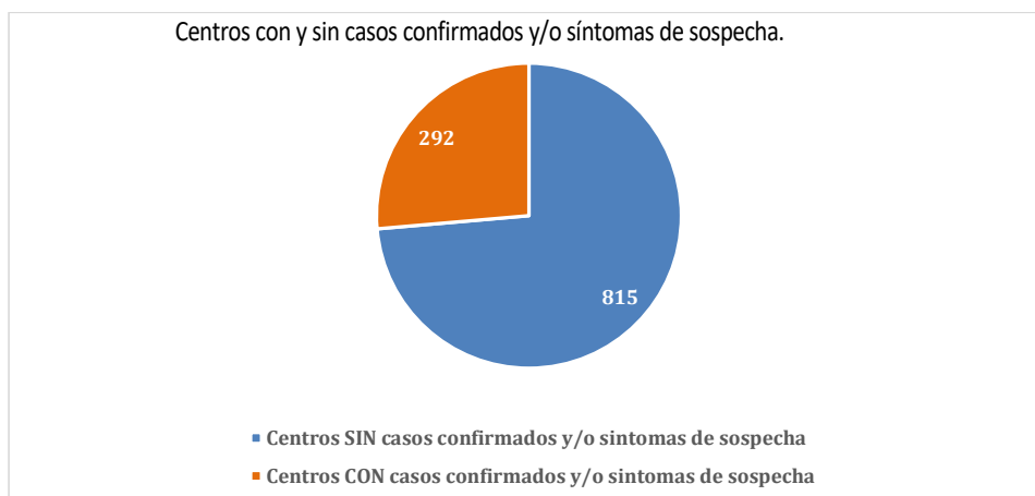
Grafico 1: Centros con y sin casos confirmados y/o síntomas de sospecha.

Total, de centros que NO presentan casos confirmados, síntomas de sospecha o en aislamiento preventivo: 815 lo que supone 73,6% de centros limpios de COVID19