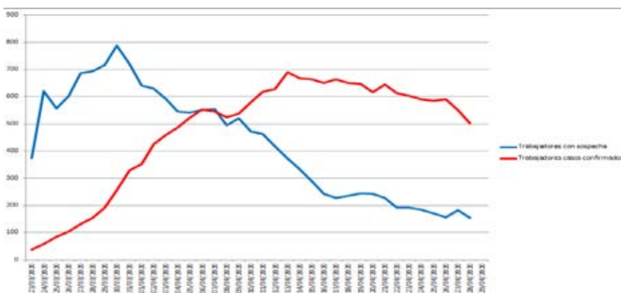
Gráfico 3. Evolución de trabajadores/as de residencias con sospecha y casos confirmados.