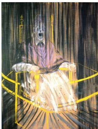
2A Francis Bacon: El Papa Inocencio X (1953).