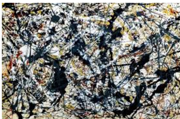
2B Jackson Pollock: Silver over black (1948).