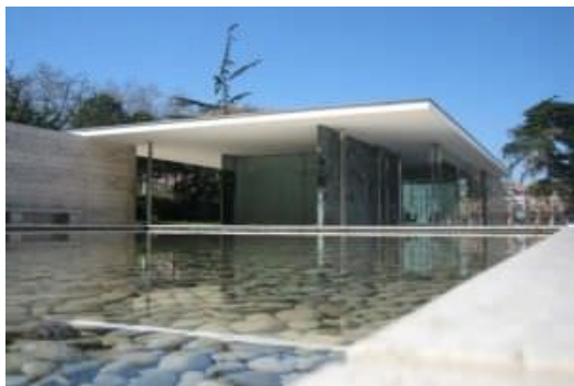
2A. Mies van der Rohe: Pabellón de Barcelona (1929).