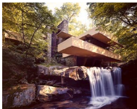
2B. Frank Lloyd Wright: Casa de la Cascada (1936-39).