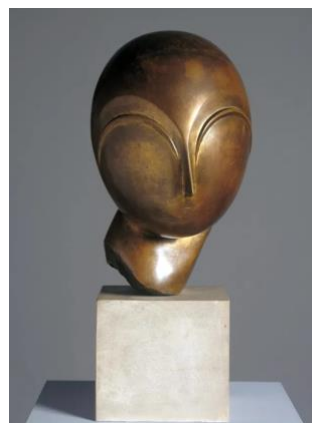
4B. Constantin Brancusi, Danaïde , 1918.