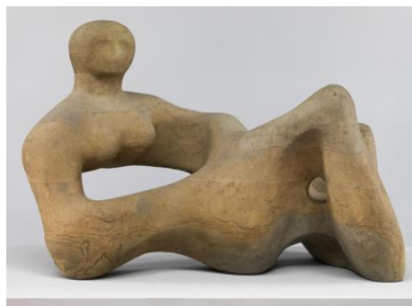
4B. Henry Moore, Figura reclinada , 1938.