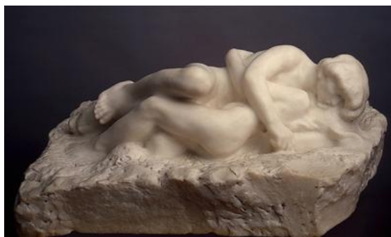
4A. Auguste Rodin, Cupido y Psique , 1905.