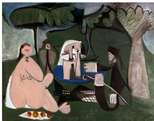
3B. Pablo Picasso, Almuerzo sobre la hierba , 1962.