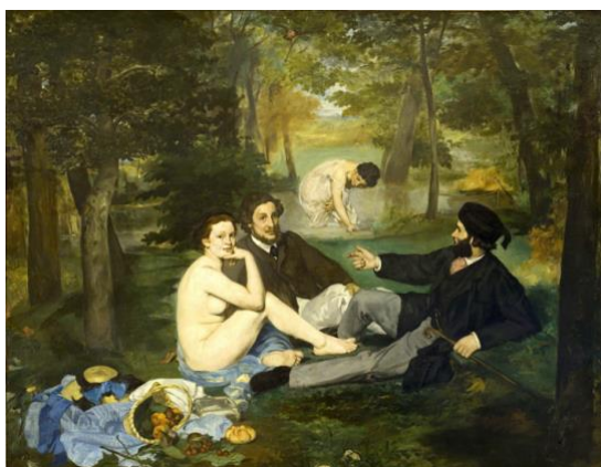
3A. Édouard Manet, Almuerzo sobre la hierba , 1863.