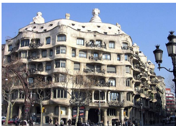
2A. Antonio Gaudí: La Casa Milà o Pedrera (1906-12).