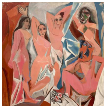
3B. P. Picasso: Las señoritas de Avignon . 1907.