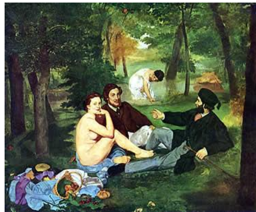
2B. E. Manet: Desayuno sobre la hierba . 1863