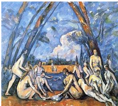
3A. P. Cézanne: Las grandes bañistas . 1900-1906.