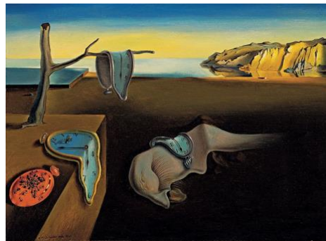
3B. S. Dalí: La persistencia de la memoria . 1931.