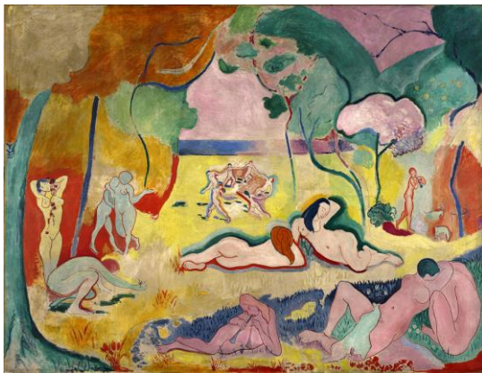
2A. H. Matisse: La alegría de vivir . 1906.