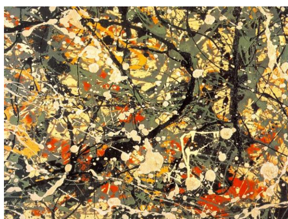
2B. Jackson Pollock: Pintura número 8 (detalle) (1949).