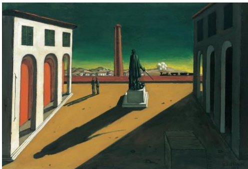
3A. G. de Chirico: La plaza . 1913.