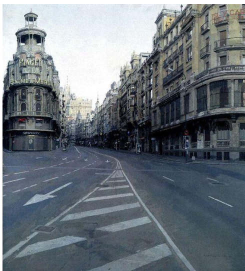
2A. A. López: La Gran Vía . 1974-81