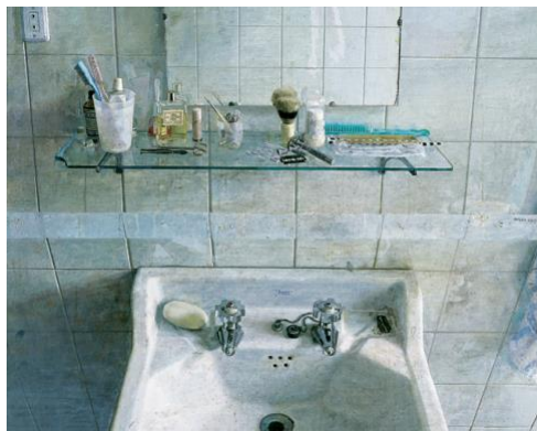
4A. A. López: Lavabo y espejo . 1967.