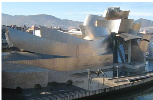
2B. Frank O. Gehry: Museo Guggenheim de Bilbao (1991-1997).