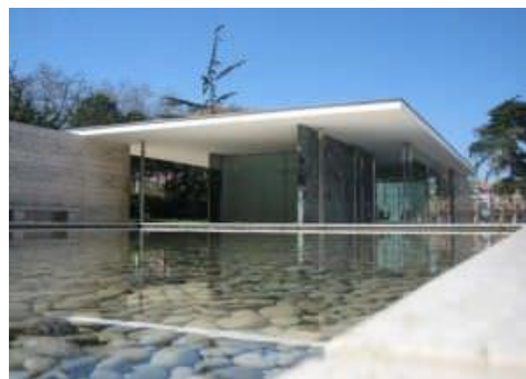
4B. L. Mies van der Rohe: Pabellón de Alemania . 1929.