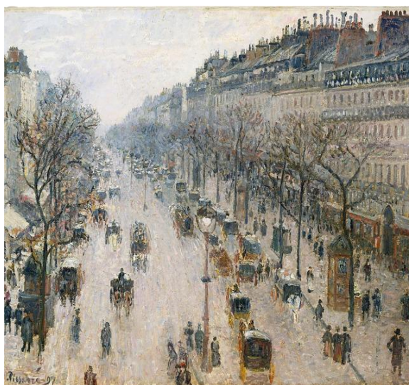
2B. C. Pissarro: El Bulevar Montmartre . 1897.