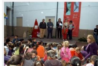
La comunidad educativa Cardenal Spínola inicia el proceso de transformación socio-educativa. ... EN R2 U E