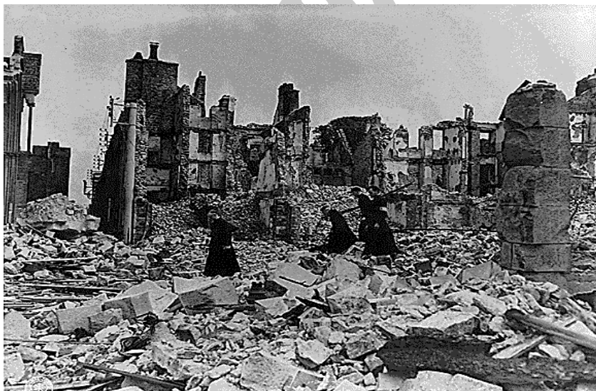
"Once there was a church", ca. 08/14/1944 ARC Identifier: 196303