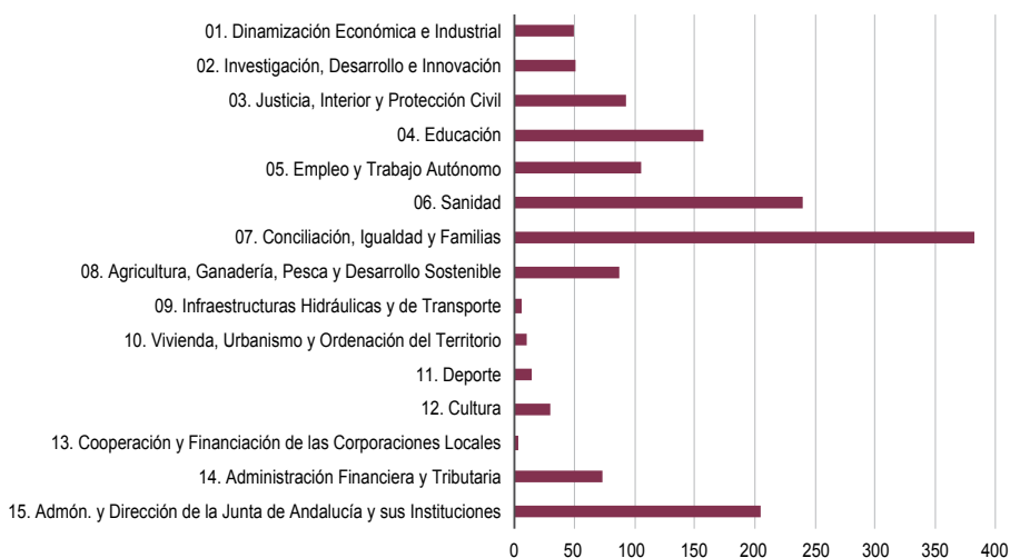
GRÁFICO 5.3. Indicadores por Políticas Presupuestarias. Presupuesto 2019

continuación, la política Administración y Dirección de la Junta de Andalucía y sus Instituciones reúne un 13,7% de indicadores (204). Educación, por su parte, cuenta con 156 indicadores (10,4%). El resto de políticas presupuestarias concentran menos del 10% de indicadores presupuestarios de género.