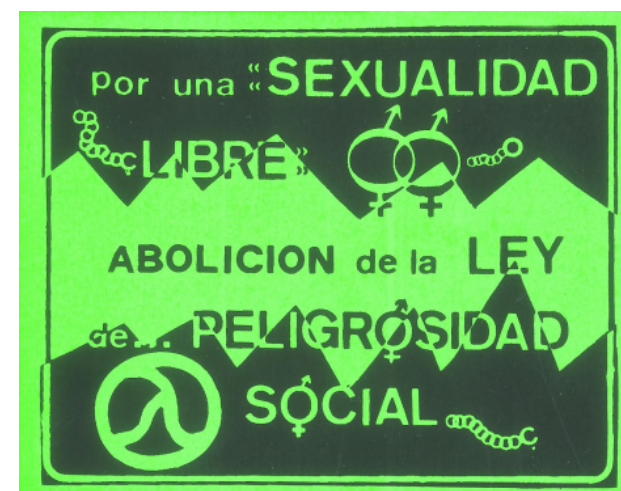
Fig. 4. Adhesivo con el eslogan "Por una sexualidad libre. Abolición de la Ley de Peligrosidad Social." (Fecha desconocida).

Por todo ello, la donación e ingreso en el Archivo General de Andalucía de esta colección de documentos ayuda a divulgar y difundir un capítulo de la lucha por las libertades civiles en nuestra región, poco conocido.