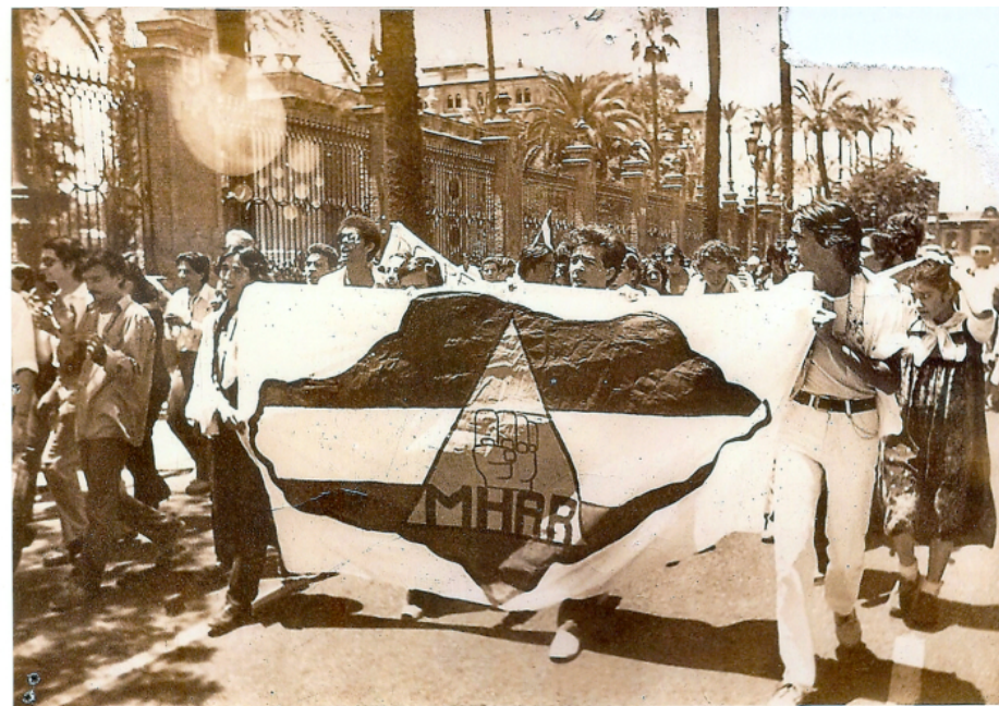
Fig. 3. Grupo de manifestantes por la calle San Fernando portando una pancarta con el mapa de Andalucía y un triángulo en medio con un puño cerrado y el acrónimo del Movimiento Homosexual de Acción Revolucionaria (MHAR). Archivo General de Andalucía. F.61//10030

Por tanto, la documentación donada, recopilada personalmente