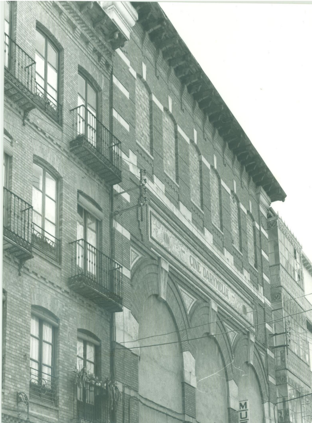
Fig. 1. Teatro Darymelia. Jaén. Programa en estudio. D.G. Arquitectura y Vivienda. Consejería de Política Territorial. Junta de Andalucía. 1980-1985.

Código de referencia: ES.41188/Consejería Política Territorial B-44