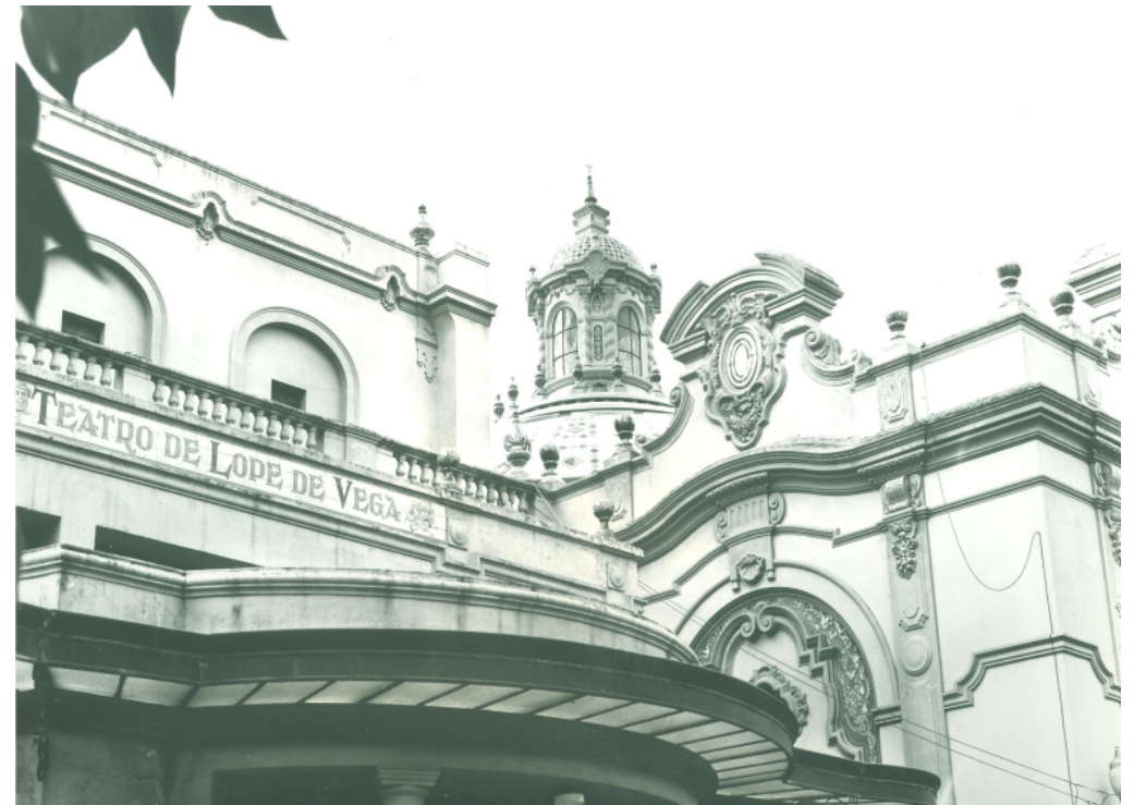
Fig. 2. Teatro Lope de Vega. Sevilla.

El Teatro Municipal de Utrera también fue objeto de una destacada rehabilitación. El Teatro fue diseñado para albergar una gran sala para representaciones operísticas con el fin además que pudiera aplicar una variada programación de obras teatrales, conciertos y otros espectáculos. El Ayuntamiento de Utrera adquirió el inmueble en junio de 1985, para su rehabilitación y cuyas obras finalizaron en 1993 con un gran escenario que ofrecer al público. El teatro utrerano es definido por algunos expertos con un diseño "a la italiana" por su equilibrada distribución en la sala y el escenario que, junto al resto de las instalaciones, conforma un espacio vivo de actividad artística y municipales reformadas en las capitales andaluzas: el Teatro Darymelia de Jaén, recuperado en Teatro Cervantes de Málaga, adquirido por el ayuntamiento en 1984; el Gran Teatro de Córdoba que fue rehabilitado en 1986; el Teatro Lope de Vega de Sevilla, restaurado para la celebración de la Expo del 92, y el Gran Teatro Falla de Cádiz, rehabilitado en 1990.