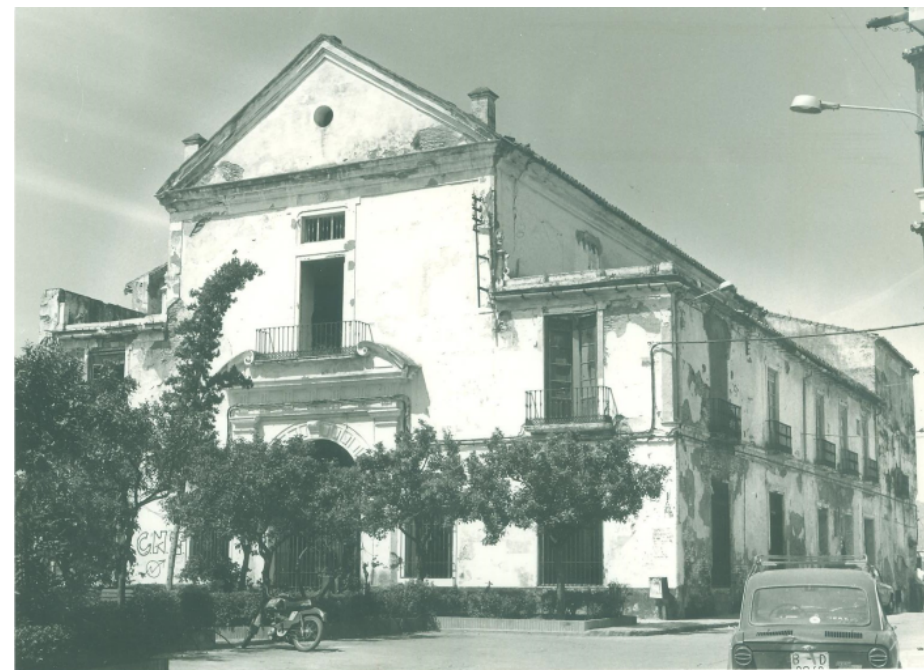
Fig. 3. Teatro Municipal. Aguilar de la Frontera. Córdoba.