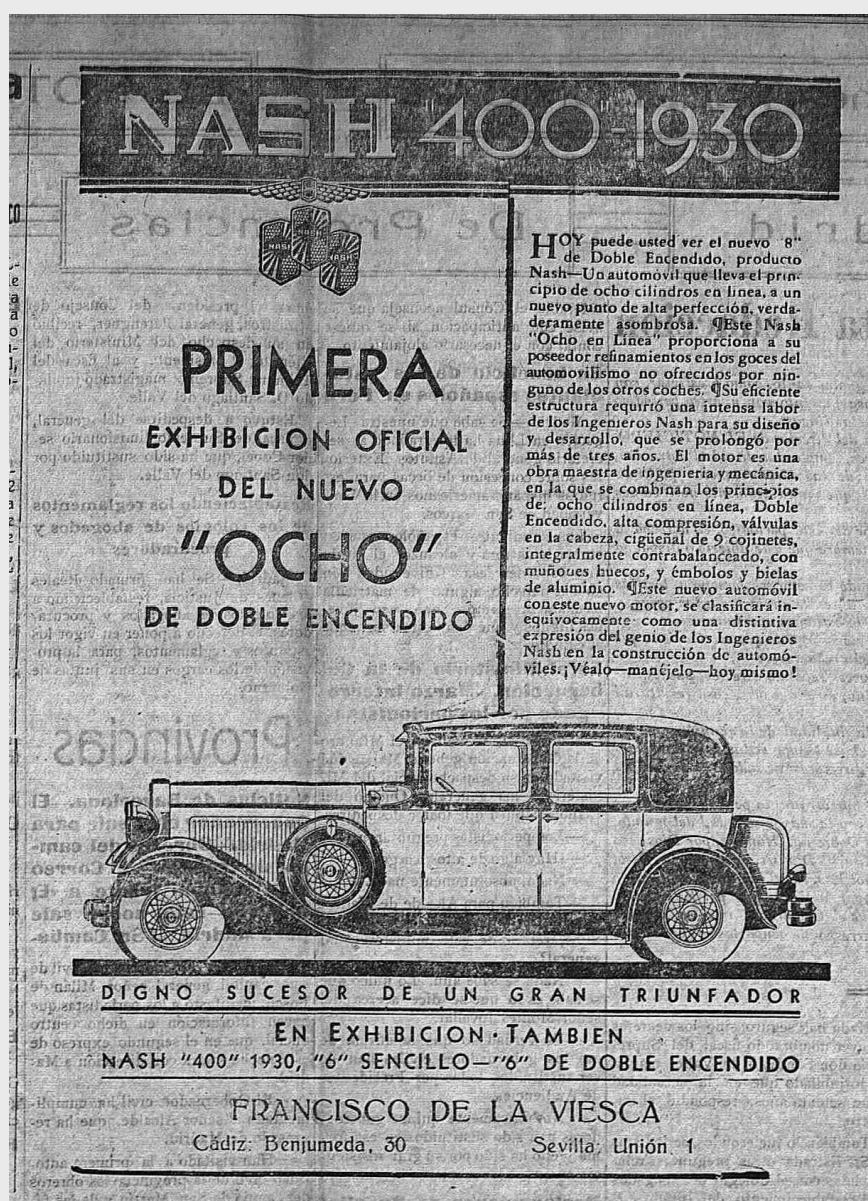
Anuncio en "El Noticiero" 4/02/1930.