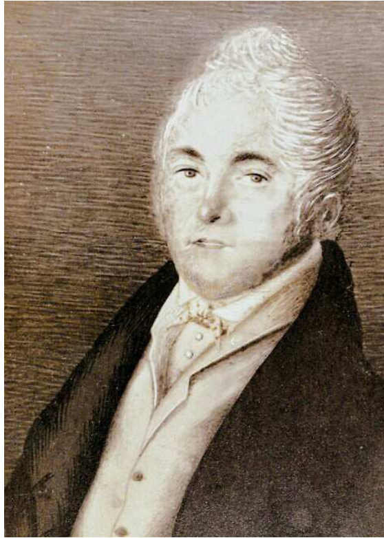
Juan Nicolás Böhl de Faber