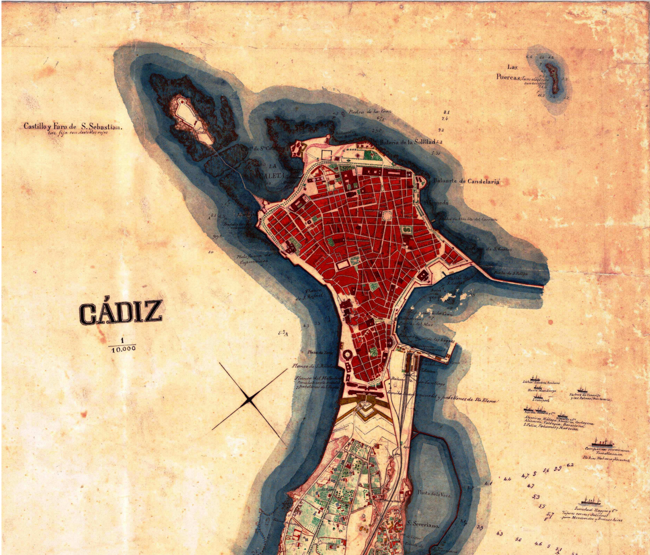
Plano de los contornos de Cádiz, (ca. 1890).