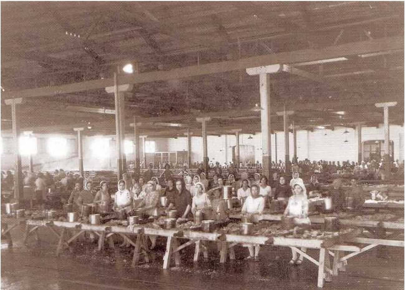
Estibadoras en el poblado de Sancti-Petri.

El Seguro de Enfermedades profesionales se creó en 1936 se desarrolló durante años después, actuando en enfermedades como la silicosis, abonándose el 50% del salario durante 18 meses con un preceptivo reconocimiento previo.