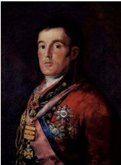
Sir Arthur Wellesley, primer duque de Wellington. Retrato de Francisco Goya. National Gallery de Londres