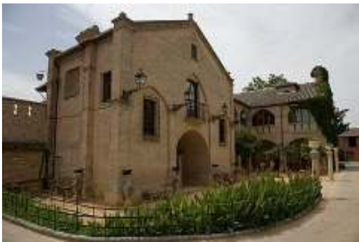
Casa Real en el Soto de Roma.