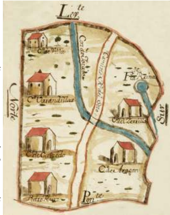
Catastro de Ensenada. Respuestas particulares del vecindario eclesiástico y secular de los cortijos fuera del arbolado del Real Soto de Roma. Libro 1236.

El lugar llamado Real Soto de Roma cercano al pueblo de Fuente Vaqueros, fue propiedad real desde la Reconquista hasta que en 1765 Carlos III lo regaló a Richard Wall, revirtiendo a la Corona tras la muerte de este. En el reinado de Carlos IV, fue donado a su ministro Manuel Godoy, para volver de nuevo al patrimonio real al caer en desgracia el Príncipe de la Paz.