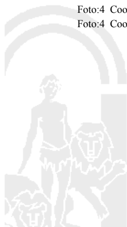
Foto:3 Coordenada X:190830,87 Coordenada Y:4163742,11 Foto:3 Coordenada X:190831,57 Coordenada Y:4163742,06 Foto:3 Coordenada X:211895,18 Coordenada Y:4166948,6 Foto:3 Coordenada X:212392,77 Coordenada Y:4166828,58 Foto:4 Coordenada X:190830,87 Coordenada Y:4163742,11 Foto:4 Coordenada X:190831,57 Coordenada Y:4163742,06 Foto:4 Coordenada X:202845,69 Coordenada Y:4158457,97 Foto:4 Coordenada X:202886,14 Coordenada Y:4157540,26 Foto:4 Coordenada X:211895,18 Coordenada Y:4166948,6 Foto:4 Coordenada X:212392,77 Coordenada Y:4166828,58

80016 Distancia entre colmenares admisibles inferior a 1 kilómetro, según Anexo I de la Orden de 26 de mayo de 2015.