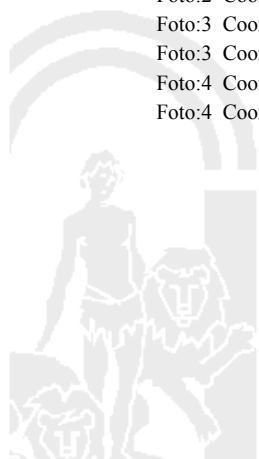
Foto:1 Coordenada X:234948 Coordenada Y:4176332 Foto:1 Coordenada X:235177,61 Coordenada Y:4177235,44 Foto:2 Coordenada X:234948 Coordenada Y:4176332 Foto:2 Coordenada X:235177,61 Coordenada Y:4177235,44 Foto:3 Coordenada X:234948 Coordenada Y:4176332 Foto:3 Coordenada X:235177,61 Coordenada Y:4177235,44 Foto:4 Coordenada X:234948 Coordenada Y:4176332 Foto:4 Coordenada X:235177,61 Coordenada Y:4177235,44

80016 Distancia entre colmenares admisibles inferior a 1 kilómetro, según Anexo I de la Orden de 26 de mayo de 2015.