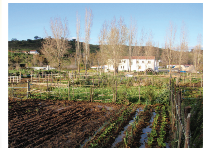
Huertos sociales de Cazalla de la Sierra (Sevilla)