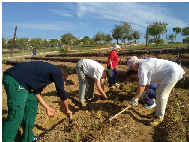
Trabajo comunitario en el huerto social Parque de la Asomadilla (Córdoba)

En la campiña, por su parte, existen muchos trabajadores del campo pero pocos propietarios de tierras, lo que justifica que los ayuntamientos cedan en usufructo a la ciudadanía pequeñas parcelas de cultivo para autoconsumo.