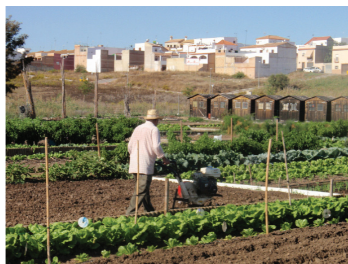
Hortelano trabajando en los huertos sociales de Villamartín (Cádiz)

En el contexto de este boletín, se entienden los huertos sociales de autoconsumo como espacios compartidos para el desarrollo de cultivos no profesionales, en los que se promueve la utilización de técnicas agrícolas acordes con la producción ecológica, teniendo sus cosechas como destino el autoconsumo y no la comercialización.