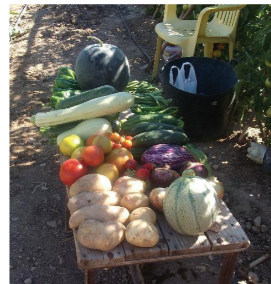
Cosecha en los huertos sociales de Pulpi (Almería)

unidos para compartir esta actividad, que vienen a sumarse a esta fuerte tendencia de aparición de huertos de carácter comunitario.