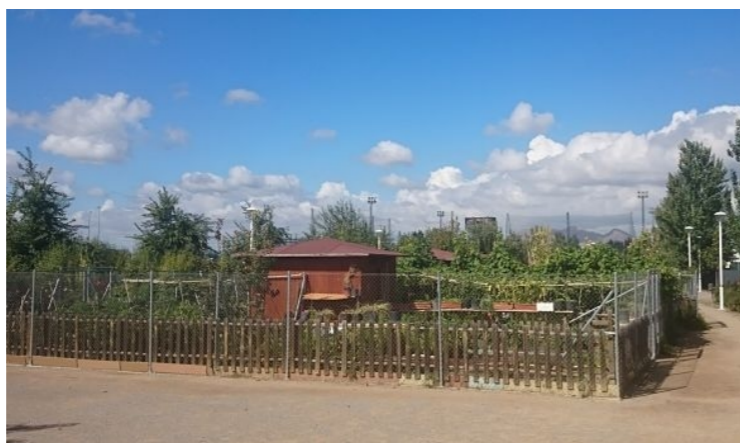
Panorámica del Huerto Parque de las Alquerías (La Chana, Granada).

Muchas de las personas mayores jubiladas que habitan en Granada proceden del medio rural, añorando el contacto con la naturaleza. Disponen de mucho tiempo libre y son personas activas que desean tener una parcela o huerto pequeño para dedicarle unas horas cada día y, así, disfrutar de un entorno natural realizando actividades con demostrados beneficios terapéuticos que repercuten en su bienestar físico y mental.