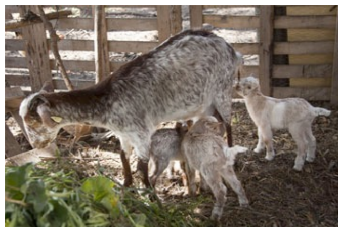
Cabras de la raza Florida en los Huertos Sociales de San Jerónimo (Sevilla).

Las cabras son muy útiles para eliminar la vegetación que crece de forma espontánea en los huertos, tanto por consumo del material retirado de las parcelas, como mediante el pastoreo directo de zonas acotadas, con lo que están poniendo en práctica un tipo de jardinería urbana con claras ventajas, ya que se aprovecha un residuo, la hierba, que genera muchos beneficios, entre los cuales son de destacar: la eliminación de consumos energéticos contaminantes por desbroces, la eliminación de molestias por ruidos de la maquinaria, así como la reducción por envenenamiento del suelo debido al uso de agrotóxicos, muy habituales en la jardinería convencional.