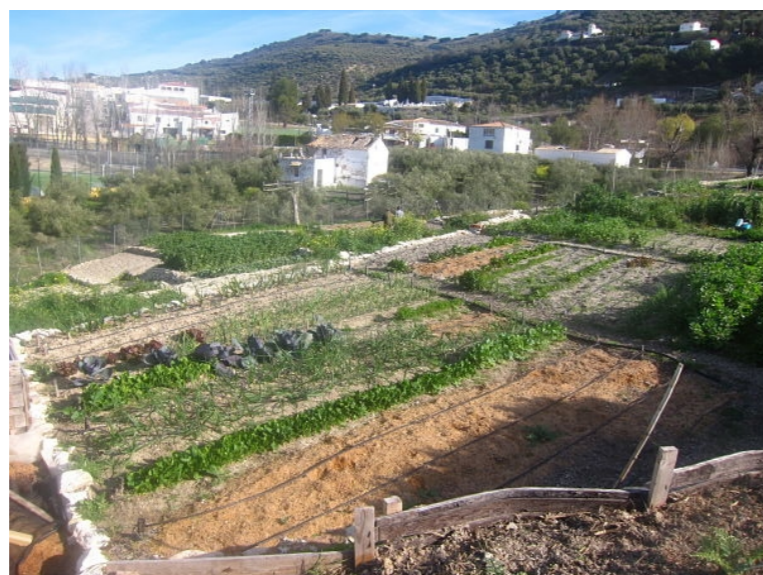
Huertos sociales en la provincia de Córdoba.

La Diputación de Córdoba, a través de su Centro Agropecuario Provincial, viene trabajando desde hace tiempo en la conservación y mantenimiento del material genético vegetal propio de la provincia y en la diversificación productiva mediante el fomento del cultivo de variedades hortícolas autóctonas. Además, esta línea de actuación, desde el año 2012, se ha visto complementada, como consecuencia de la demanda por parte de los distintos ayuntamientos, con el impulso para la implantación en los municipios de la provincia de huertos urbanos con fines sociales, educativos, productivos y medio ambientales.