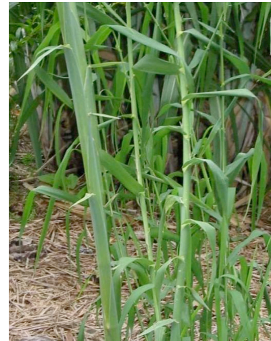
La caña común ( Arundo donax L.)

Para la utilización o aprovechamiento por particulares de los cauces o de los bienes situados en ellos se requiere la concesión previa, por lo que es necesario tramitar la autorización para el corte de cañas en zona de Dominio Público Hidráulico y en zona de policía de cauces . En esta tramitación se considerará la posible incidencia ecológica desfavorable, debiendo exigirse las