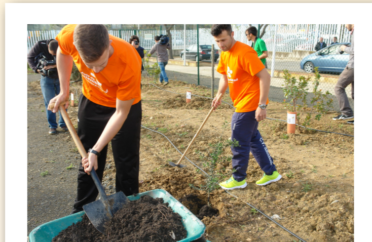
Alumnos de la Universidad de Huelva

La Universidad de Huelva ha acondicionado un espacio destinado a jardín botánico de carácter didáctico y huertos para que sean cultivados por quienes así lo soliciten. Se trata de una iniciativa gestionada por el Aula de la Sostenibilidad de la Universidad gracias a una acción impulsada desde el Campus de Excelencia CEICambio en el que participan también las universidades de Córdoba, Pablo de Olavide y Almería.