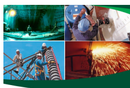
Jornadas Técnicas 2007 de INERCO Prevención de Riesgos Laborales en la Industria

Sevilla, 23 de octubre de 2007 Tartagosa, 15 de octubre de 2007