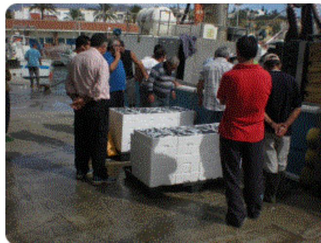
EMPLEO DIRECTO. AÑO 2014