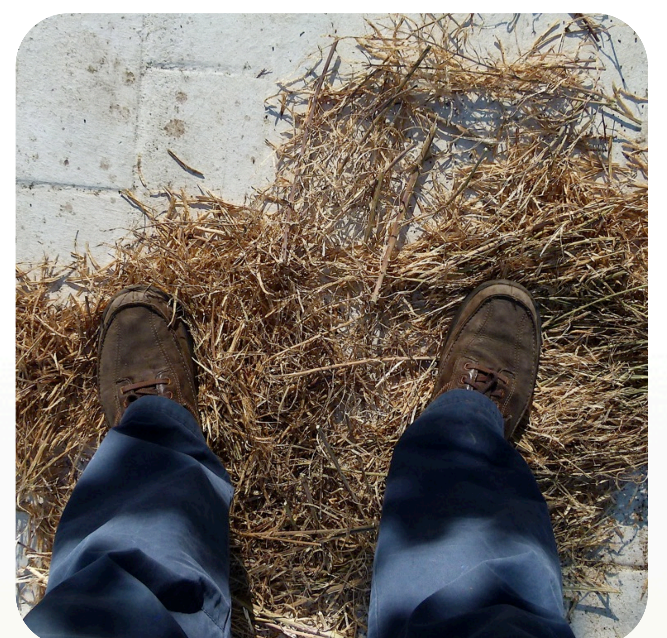
9. Trillado de los frutos de un ramo fructífero (infrutescencia) de brócoli