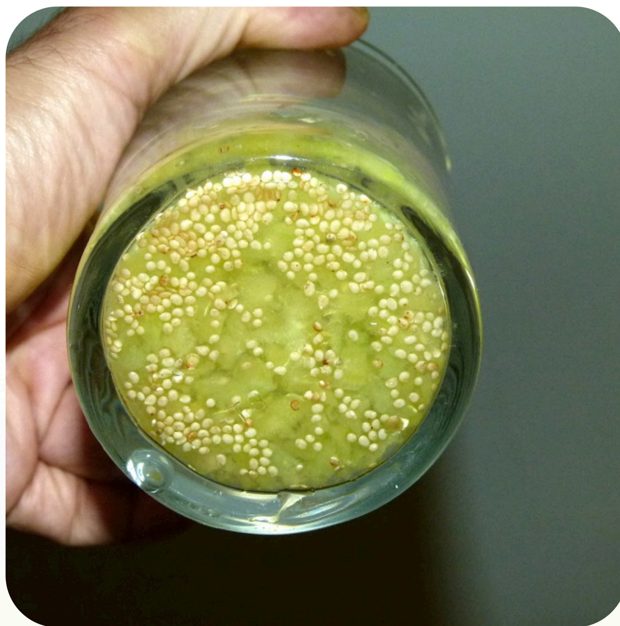
8. Separación por decantación de la pulpa y la semilla de fisalis Familia solanáceas