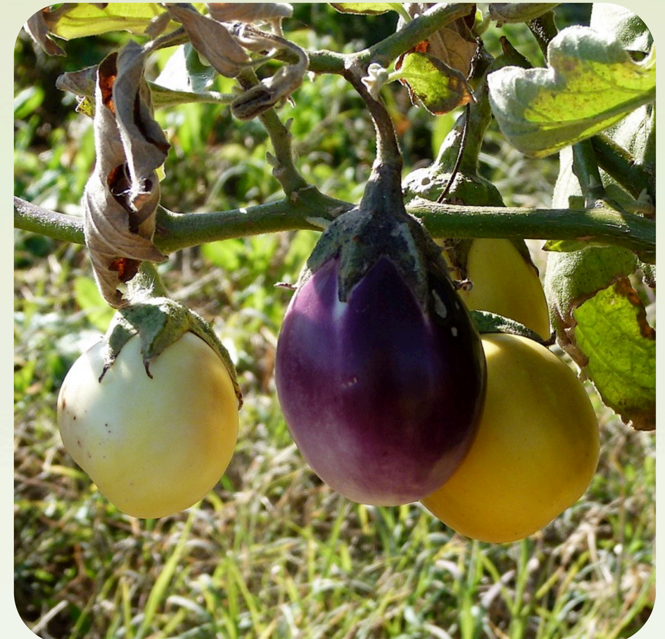
3. Frutos de berenjena en distintos estados de maduración Familia solanáceas