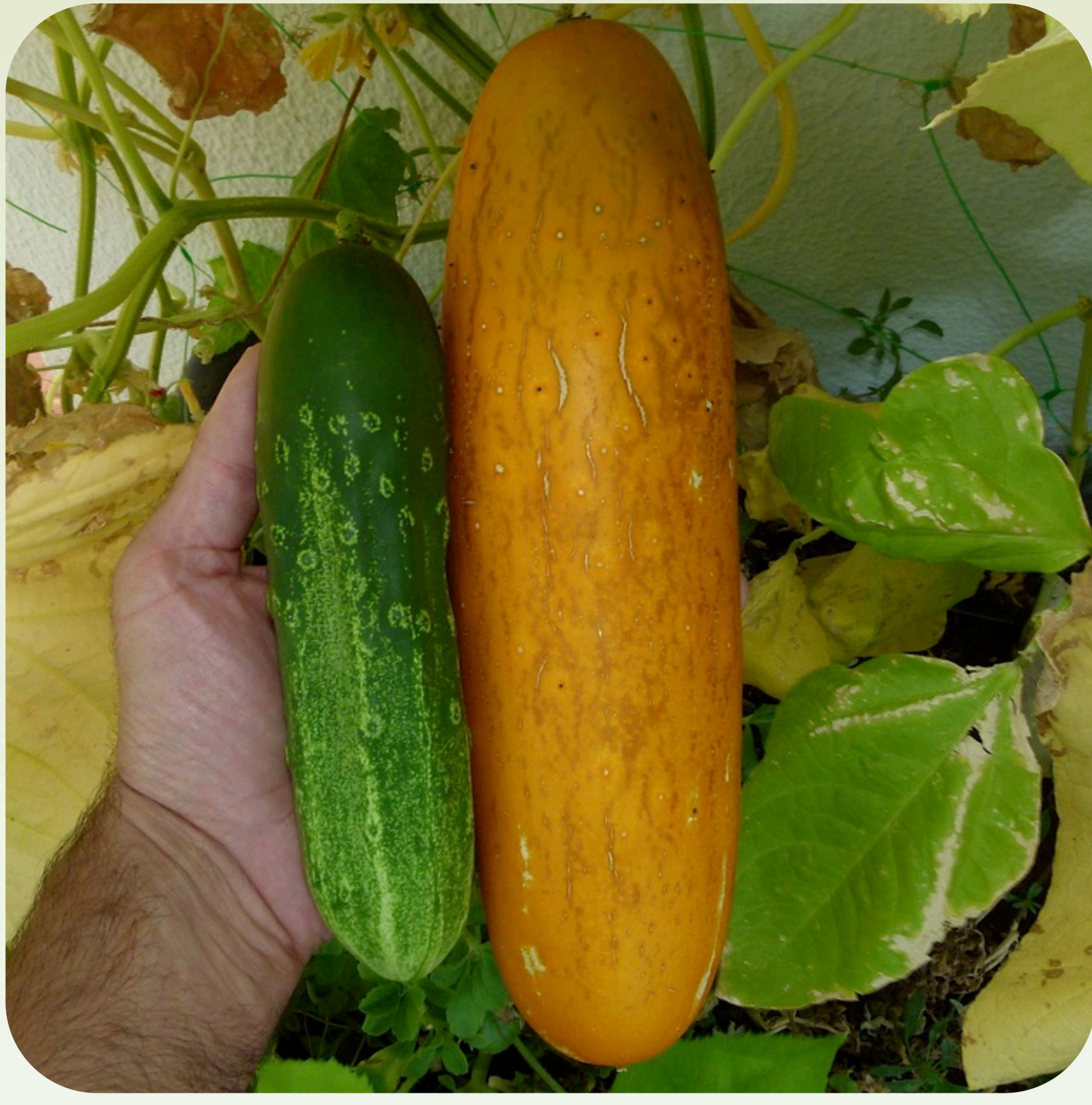
1. Frutos verde y maduro de pepino Familia cucurbitáceas