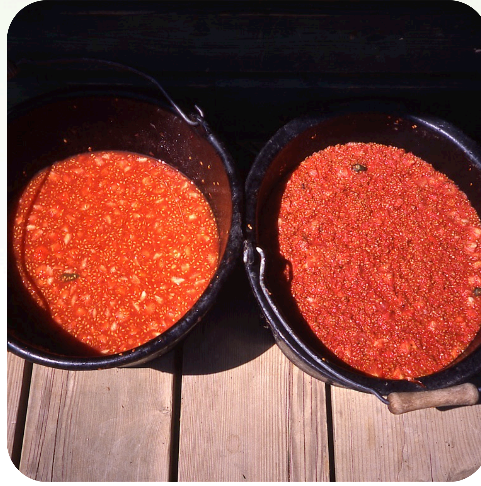
5. A la izquierda, semillas de tomate recién extraídas y, a la derecha, semillas tras varios días de fermentación