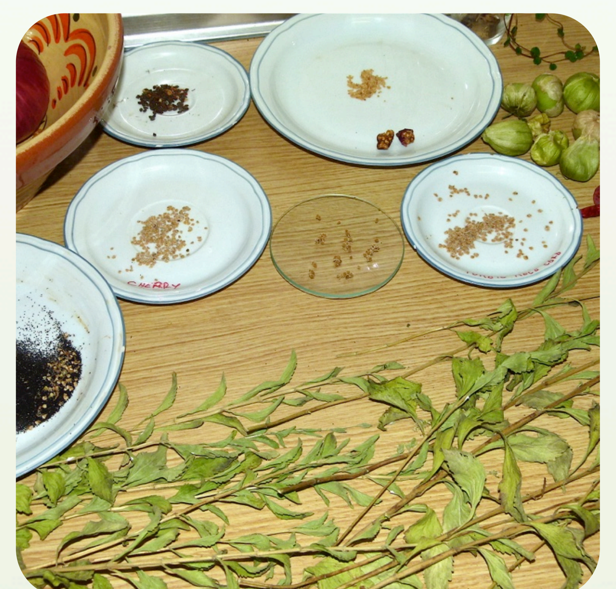
12. Conjunto de varias semillas de hortalizas acabando de secarse antes del envasado