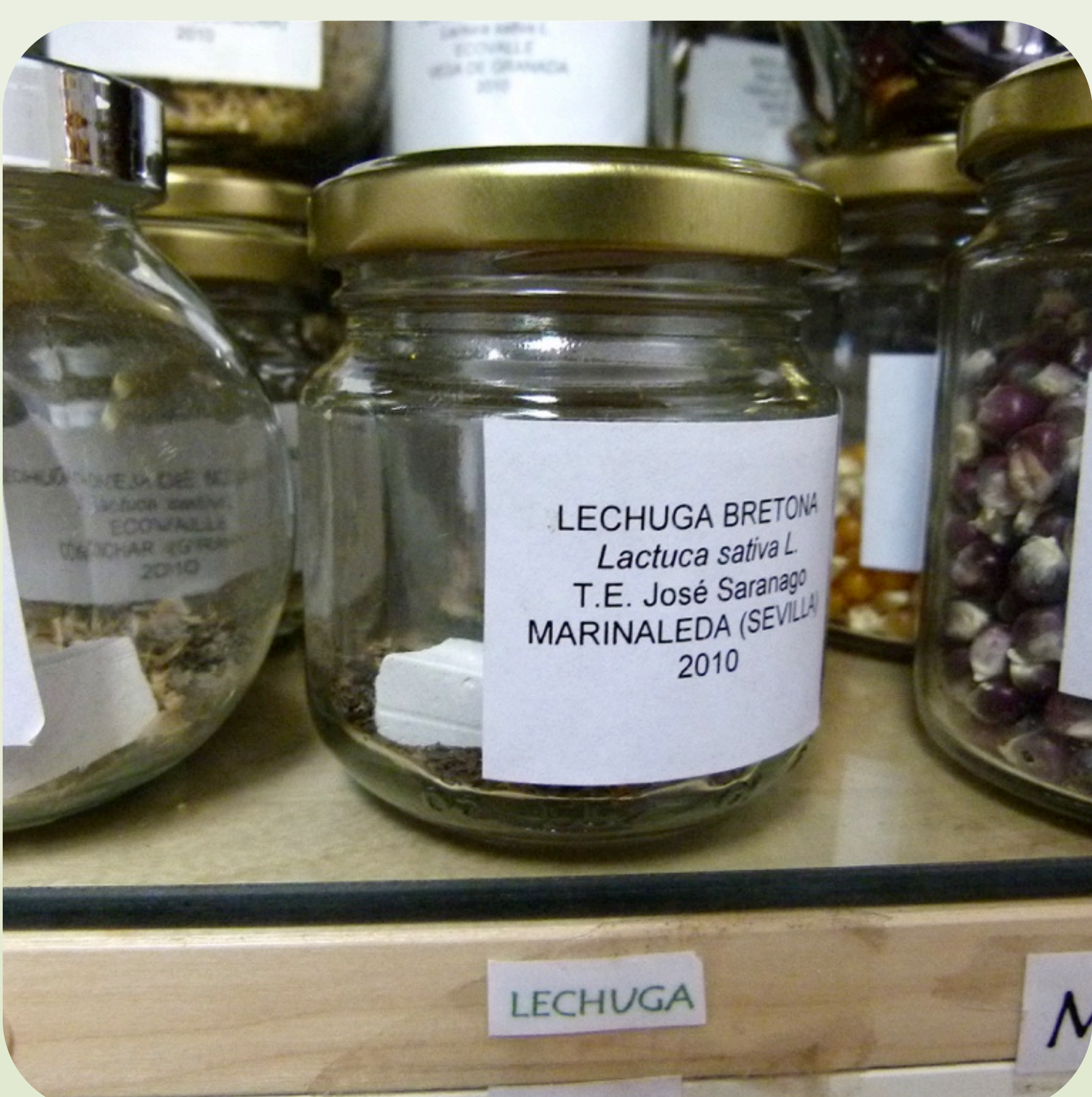
13. Semillas conservadas en sitio fresco y oscuro dentro de un frasco hermético con una tiza para absorber la humedad