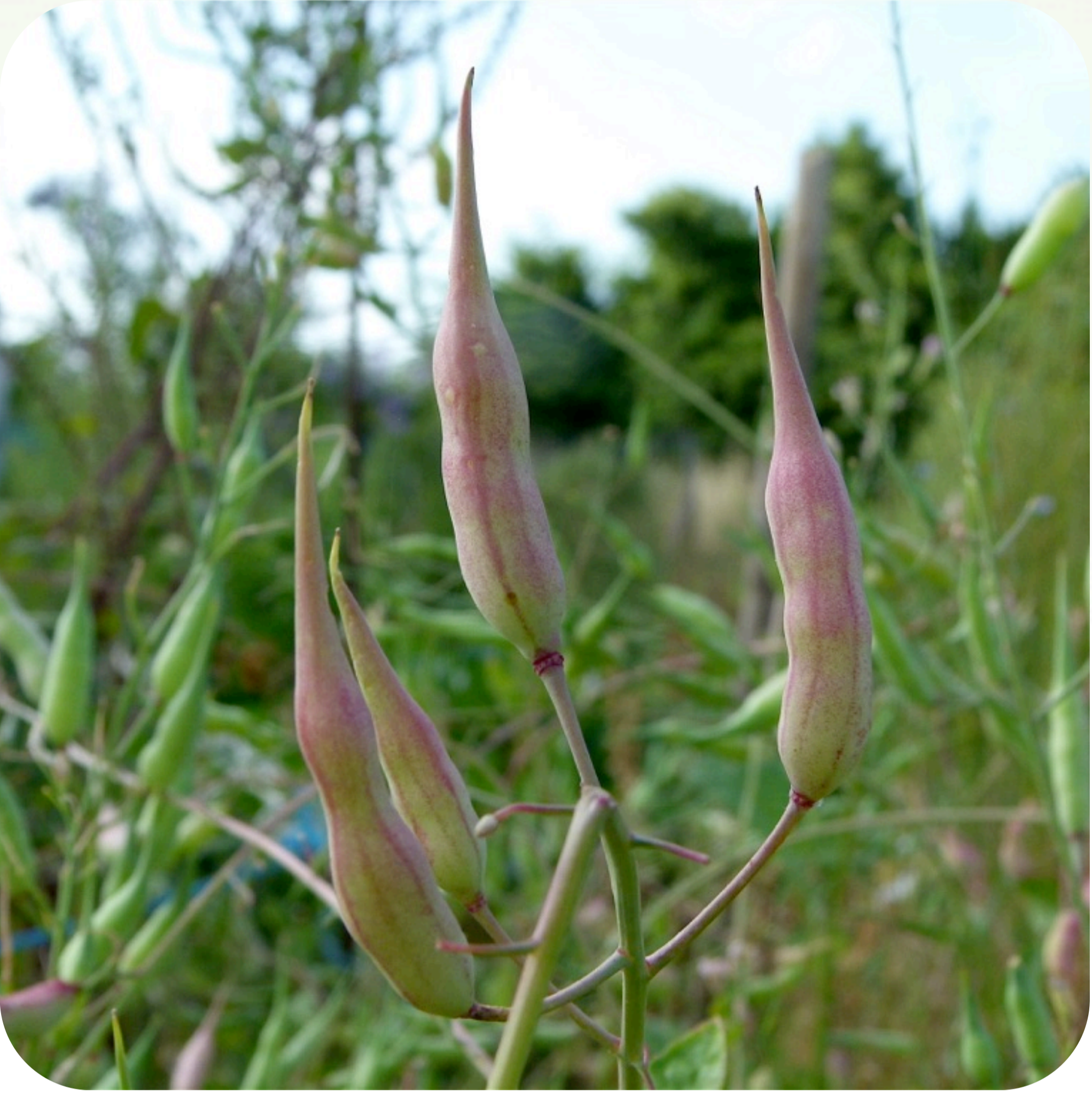
4. Frutos de rábano aún verde Familia brassicáceas (= crucíferas)