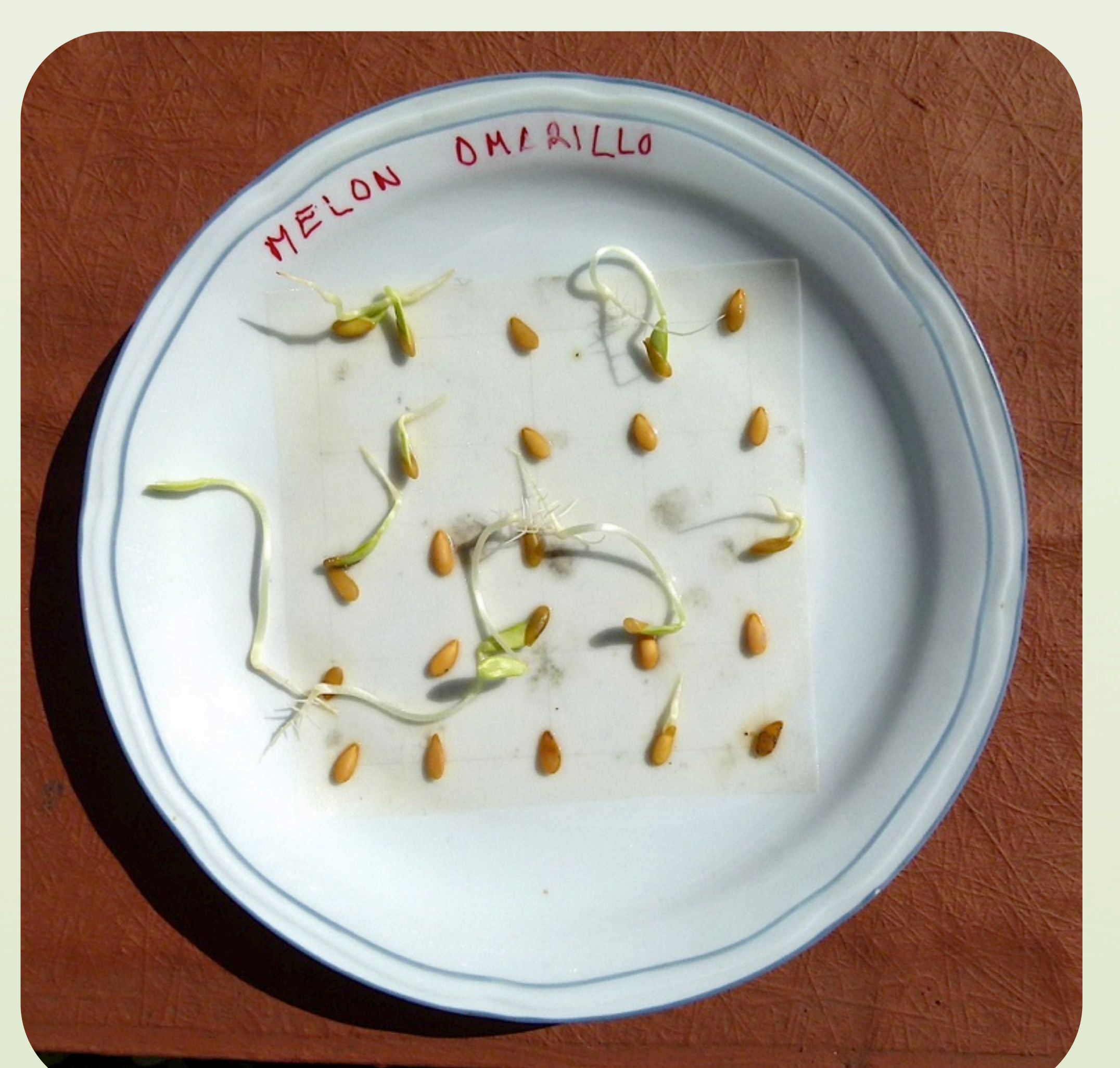
15. Test de germinación de semilla de melón mostrando una importante pérdida de poder germinativo