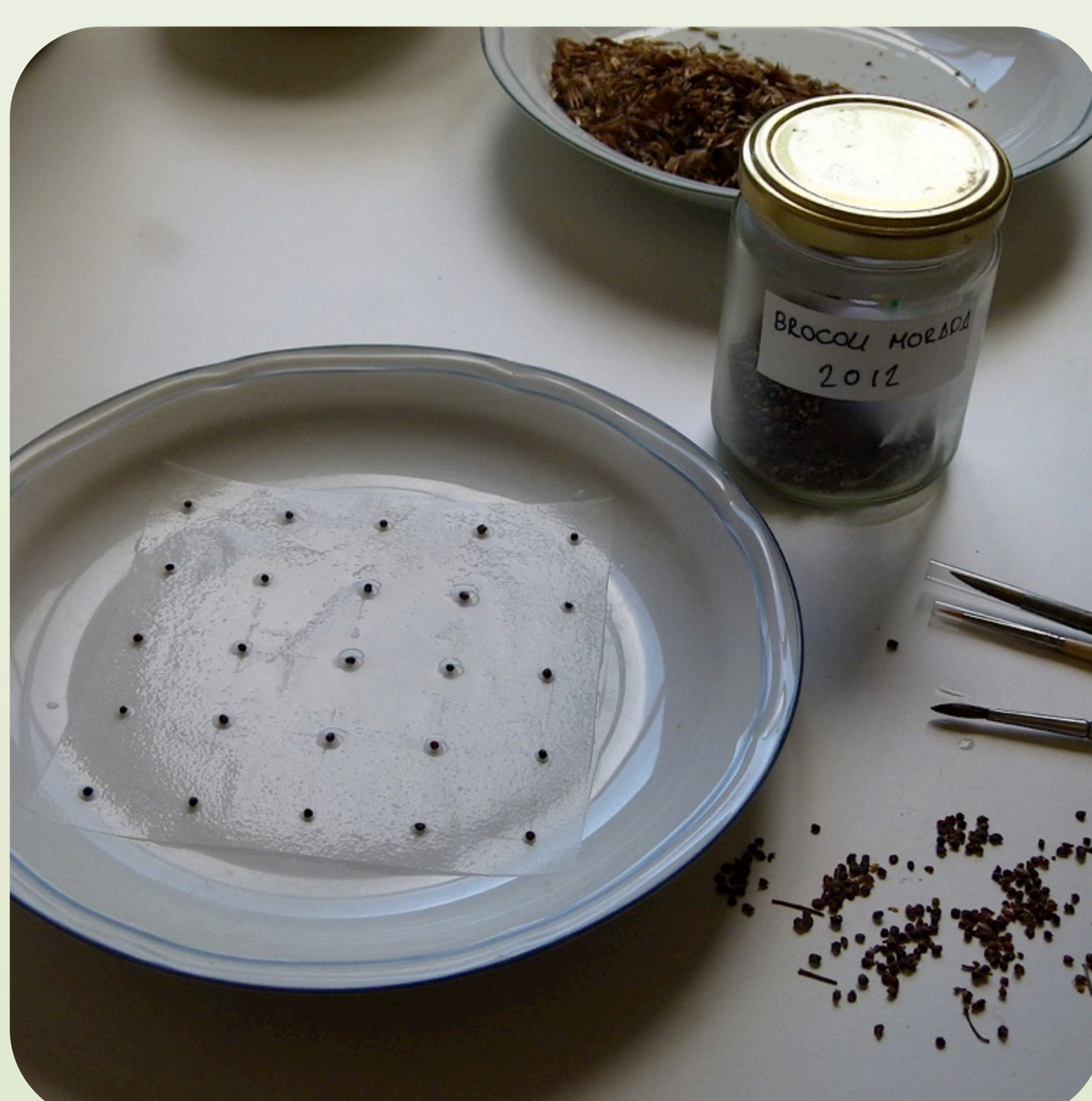
14. Preparación de un test de germinación de brócoli usando pinceles húmedos para colocar las semillas