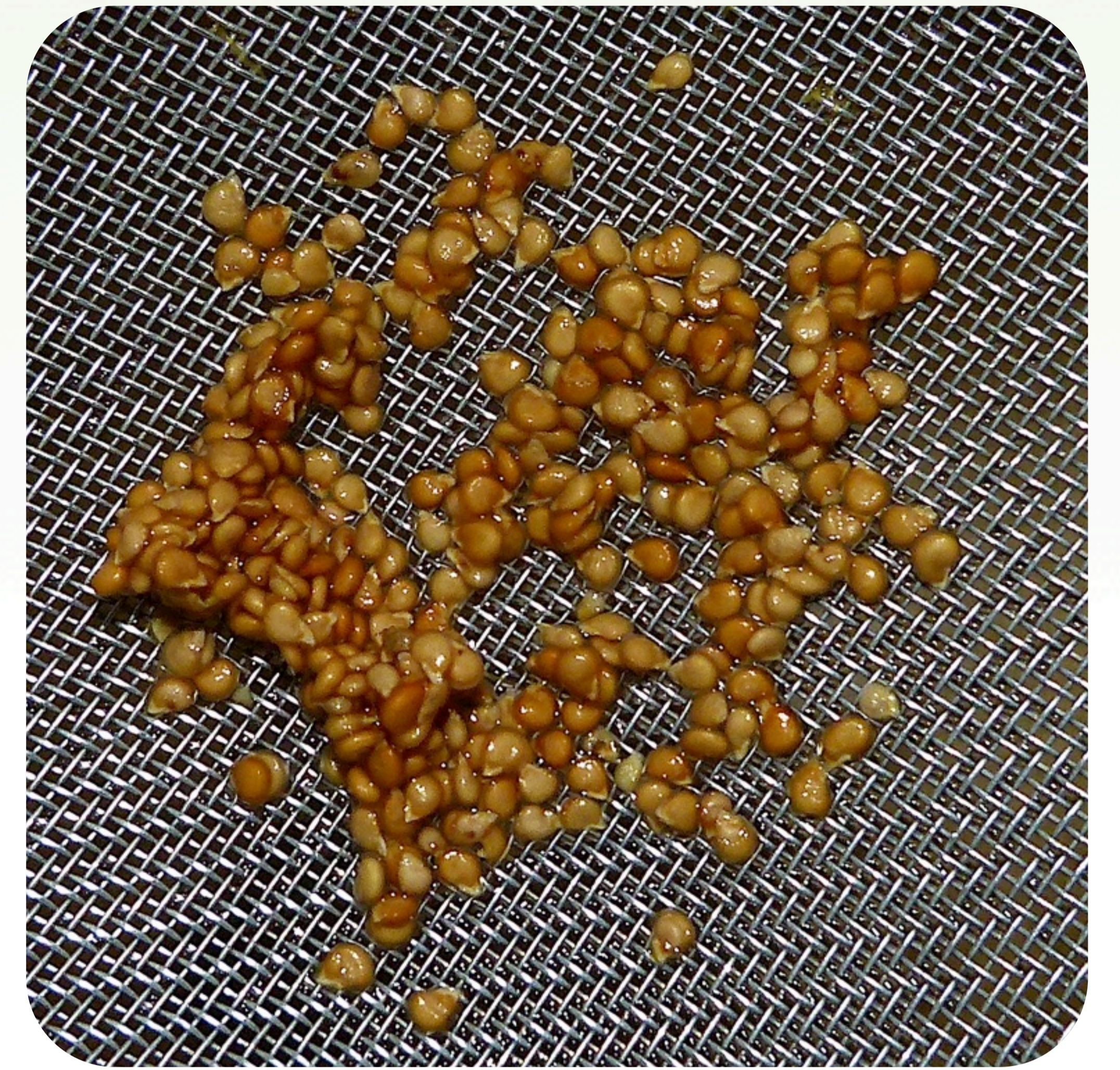
6. Lavado de semillas de tomate tras varios días de fermentación en su propio jugo