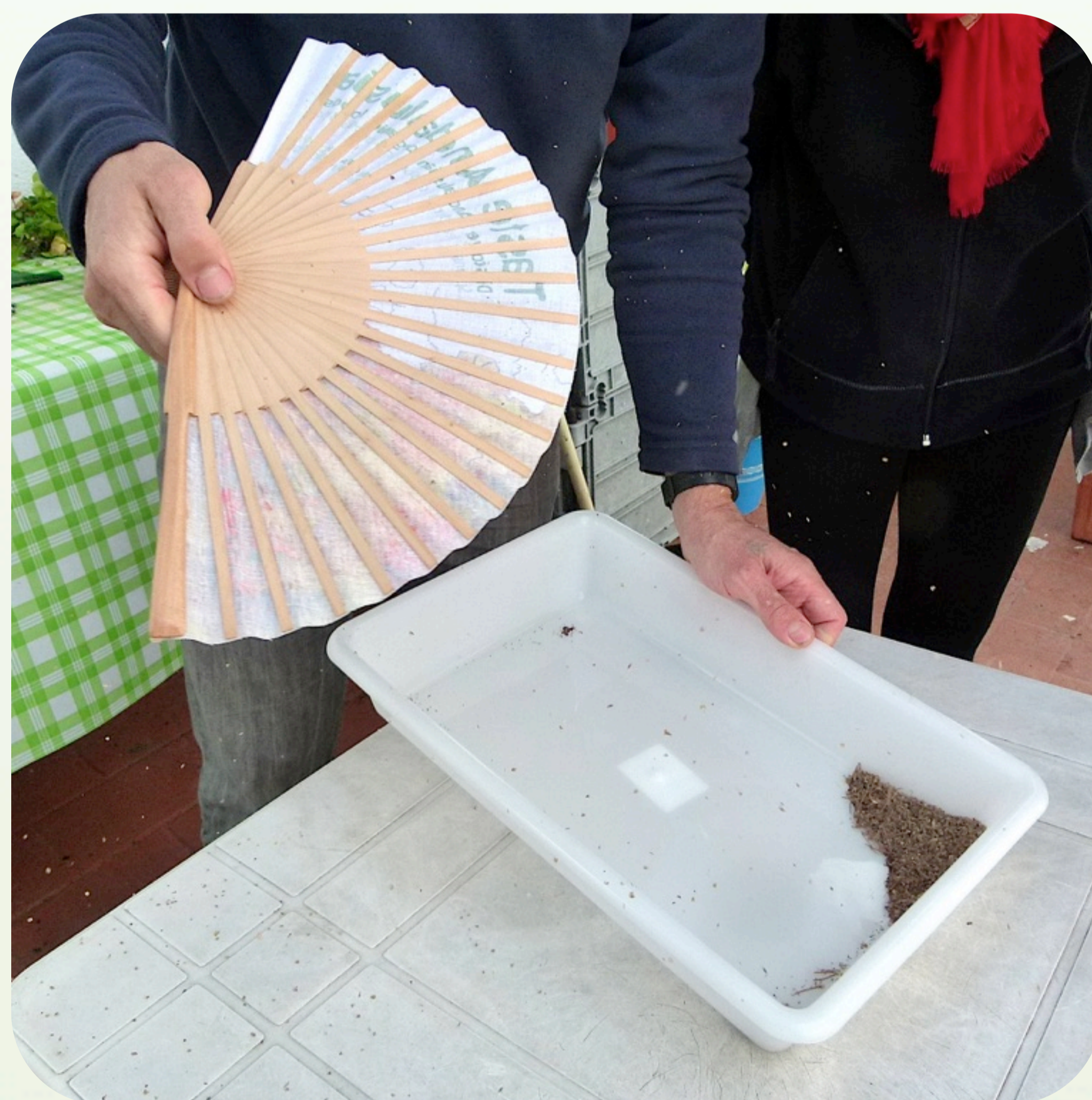
10. Aventado de semillas de tomillo Familia lamiáceas (= labiadas)