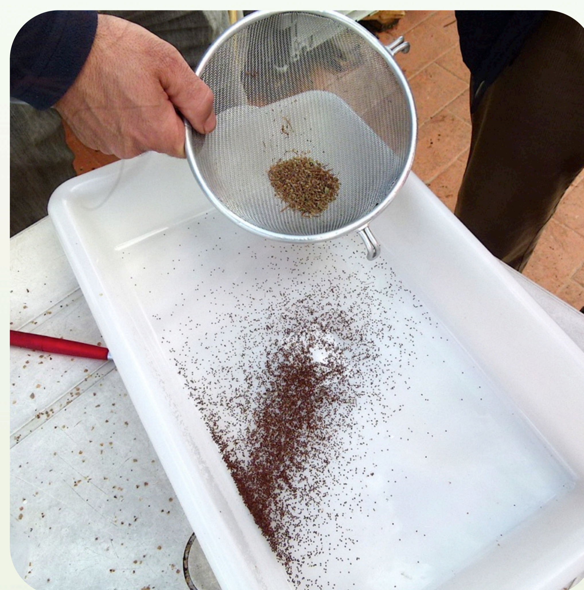
11. Cribado con colador de semillas de tomillo Familia lamiáceas (= labiadas)