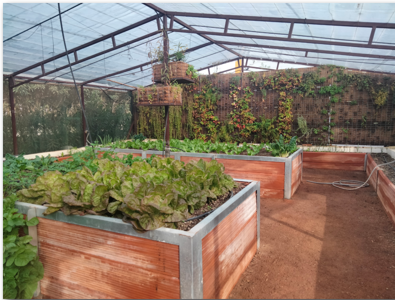
Bancal y jardín vertical

Cuenta con una zona exterior de cultivo formada por 6 arriates de unos 5 m 2 cada uno, y otra interior en la que se ubican otros 8 bancales elevados a diferentes alturas y que conforman una superficie de cultivo de aproximadamente 70 m 2 más.