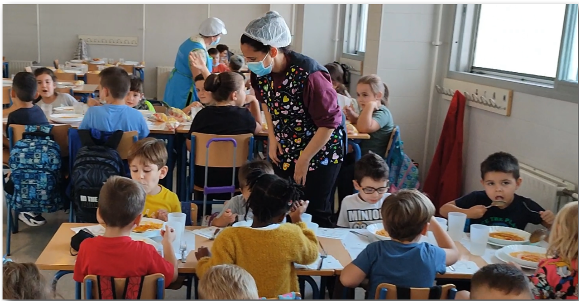
“Promoción del consumo de productos ecológicos en los comedores escolares andaluces”

Desde entonces se han consumido más de 26 millones de kilos de productos ecológicos en los centros escolares públicos de Andalucía. Actualmente, en 1.405 de estos centros se sirven platos que contienen productos ecológicos entre sus ingredientes, los cuales son consumidos cada día por 78.652 niños y niñas. Para el curso 2021-22 se estima que las empresas de restauración colectiva servirán cerca de 4 millones de kilos de estos alimentos entre sus menús .