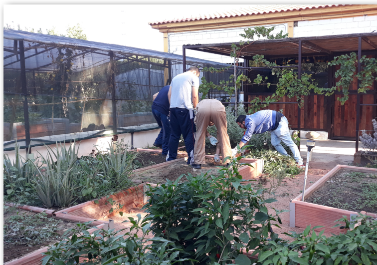
Aula de talleres, bancales exteriores e invernadero

Es en el curso 2019-2020 cuando este proyecto comienza a realizarse en las instalaciones descritas, las cuales presentan una estructura diferente y muy útil para el desarrollo de las labores básicas de jardinería.