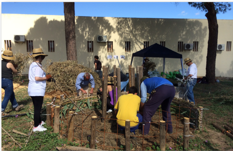
Equipo Andaluerto montando el Ojo de Cerradura. Hacienda de Quinto

Para vivir en un ambiente más saludable, con una mayor conciencia medioambiental y, además, trasladarlo a las generaciones futuras, Andaluerto propone utilizar los huertos para educar al aire libre y acercarnos de nuevo a la naturaleza, para sensibilizar sobre las consecuencias del cambio climático, proponiendo técnicas ecológicas que ayuden a paliarlo. También para valorar el trabajo agrícola y las propiedades saludables de las frutas y hortalizas procedentes de la agricultura ecológica en nuestra dieta. Todo esto se consigue cuando en cualquier espacio, por pequeño que sea, ponemos un huerto y lo compartimos con las personas de nuestro entorno.