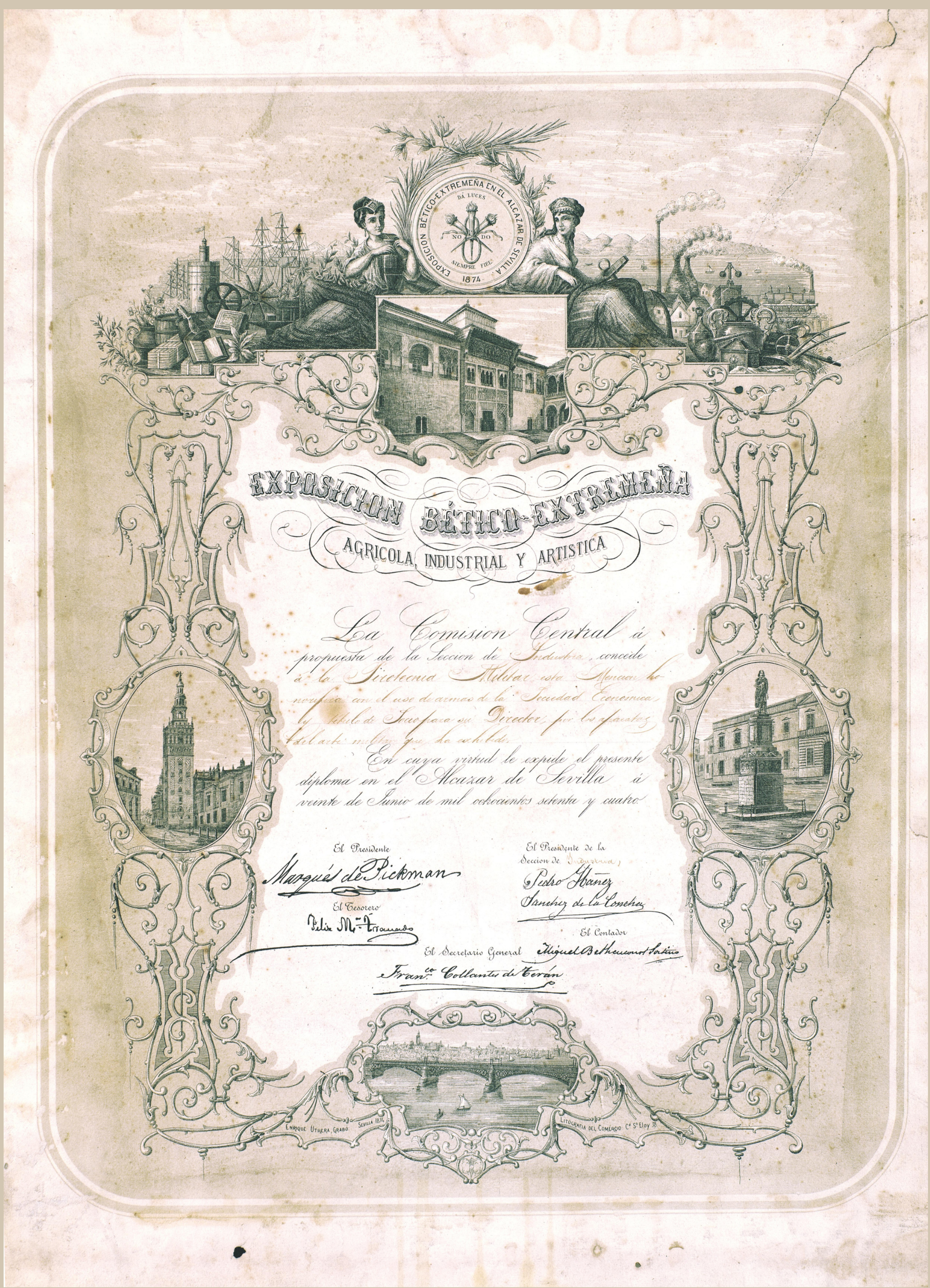
Diploma honorífico expedido por la Exposición Bético-Extremeña a favor de la Pirotecnia Militar de Sevilla. (1874)