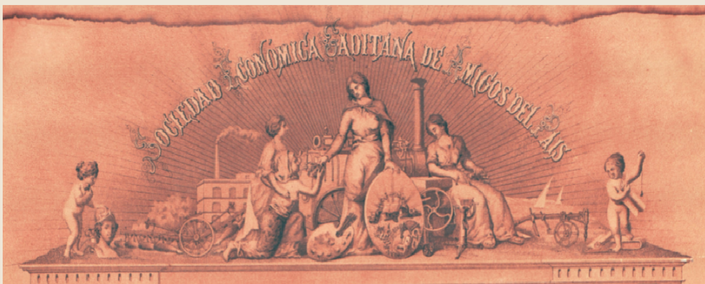
Encabezamiento del diploma de honor expedido por la Exposición Regional celebrada en Cádiz (1879).

En la segunda mitad del siglo XIX surgió la idea, por parte de grandes industriales y comerciantes, de organizar una especie de muestra internacional en la que pudieran exponerse, desde distintas partes del mundo, los productos, objetos e inventos más modernos y avanzados del momento. Así surgieron las Exposiciones Universales, como verdadero escaparate del progreso material y el poderío industrial de las grandes potencias. Este tipo de exhibiciones supusieron también una revolución en la arquitectura puesto que los mismos pabellones donde se exponían las muestras eran diseñados conforme a las últimas tendencias arquitectónicas. El éxito propagandístico de estas exposiciones hizo que se reprodujeran, en un formato más modesto, en el interior de los propios países. Así pues las "Exposiciones Regionales", repetían el mismo esquema que las universales pero en un ámbito más reducido como una manera de fomentar el mercado interno y el intercambio interterritorial.