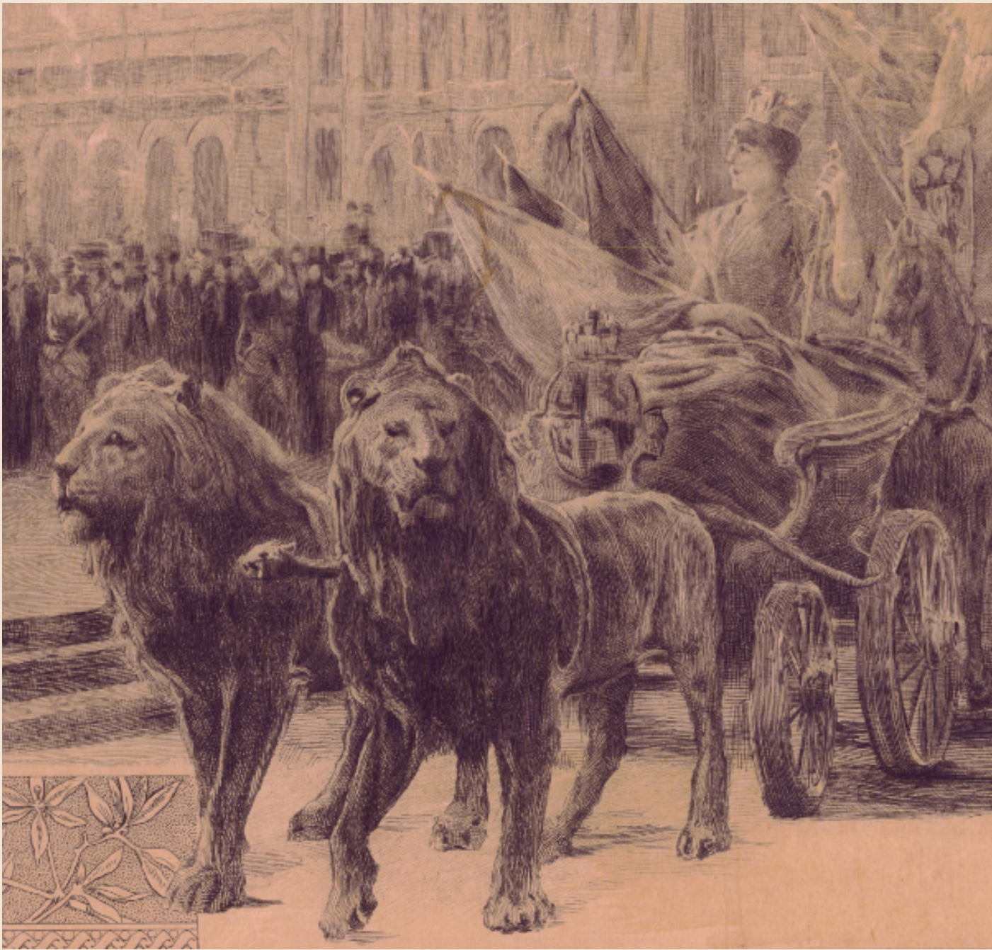
Imagen ampliada de la representación de la diosa Cibeles, sentada en un carro arrastrado por un par de leones. Exposición Universal de Barcelona (1888).