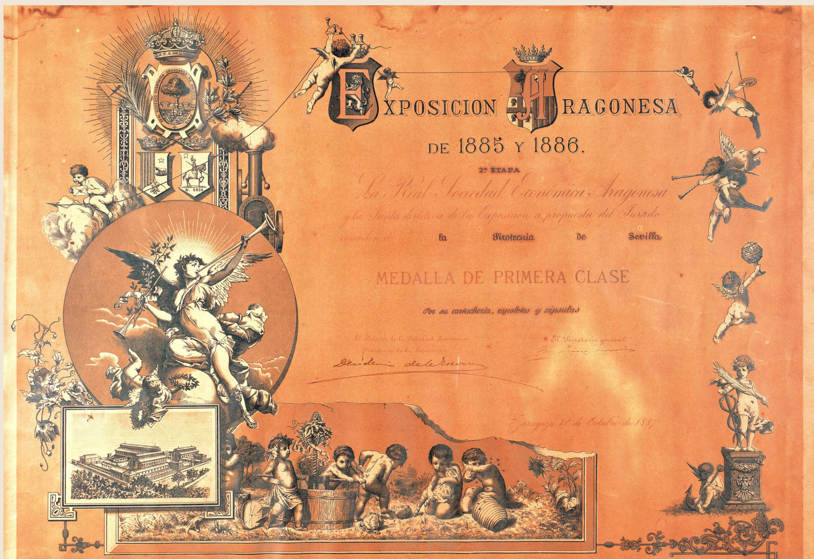
Diploma expedido por la Exposición Aragonesa (1885-1886) a favor de la Pirotecnia Militar de Sevilla concediéndole la Medalla de Primera Clase. Los productos referenciados son la cartuchería, espoletas y cápsulas.

La Pirotecnia Militar de Sevilla recibió en esta exposición la Medalla de Oro integrada en el grupo número 5, Clase 28, Sección 344 por sus "Estopines cuya construcción es tan perfecta que puede competir con los extranjero". En el diploma se puede reconocer de debajo el Escudo de Cádiz, con el héroe mitológico Hércules flanqueado por dos columnas y dos leones a sus pies.