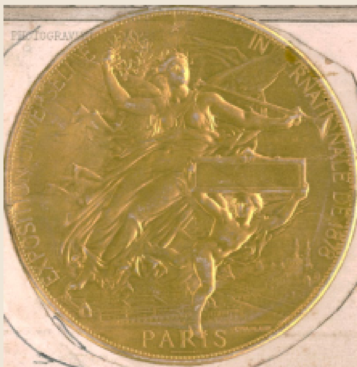
En la primera imagen podemos observar el diploma expedido por la Exposición Universal de París (1878) a favor de la Pirotecnia Militar de Sevilla. En la segunda imagen vemos una ampliación del sello, insertado en el diploma, con una alegoría de Francia representada como una diosa cívica. Archivo General de Andalucía/Fábrica de Artillería de Sevilla/AP3-FA1-B36-CP4-P12