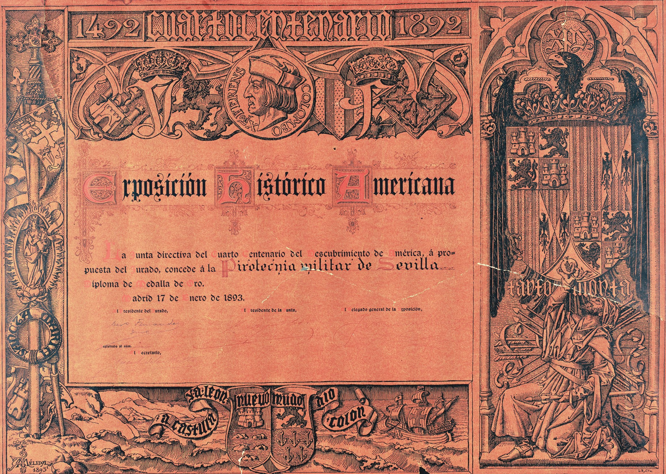
En la primera imagen podemos observar el diploma concedido a la Pirotecnia Militar de Sevilla en la Exposición Universal de Barcelona (1888). En la segunda imagen; diploma de medalla de oro concedido por la Exposición Histórico-Americana (1893) a la Pirotecnia Militar de Sevilla.