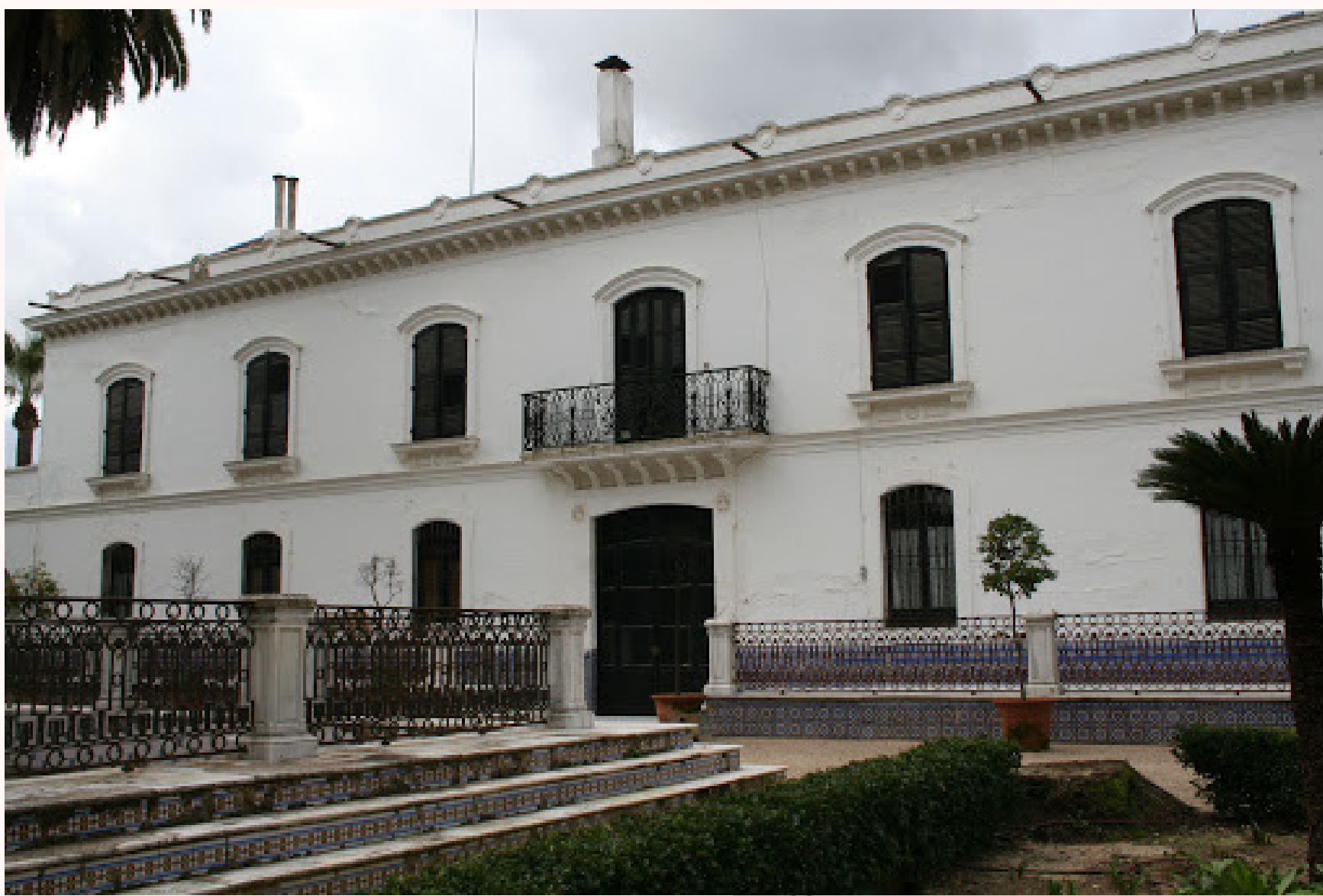
Izquierda: fachada del Palacio de los infantes de Orleans y Borbón en Villamanrique de la Condesa.

Es significativo también que en la publicación del catálogo de pinturas se omitió parte de la información consignada en el campo "observaciones" del manuscrito mecanografiado, en concreto se eliminan las referencias al lugar donde se conservan las piezas en el momento de su catalogación. El documento conservado en el Archivo General de Andalucía indica que las obras estaban repartidas entre "el chalet de Sevilla" y "el Palacio de Villamanrique". El chalet de Sevilla hace referencia a la villa Nuestra Señora de los Reyes, un edificio regionalista proyectado para la Infanta por Juan Talavera y Heredia en 1938, situado en la actual Avenida de la Palmera, esquina con Cardenal Bueno Monreal. El palacio de Villamanrique, es el que los Infantes de Orleans y Borbón tienen en la localidad sevillana de Villamanrique de la Condesa.