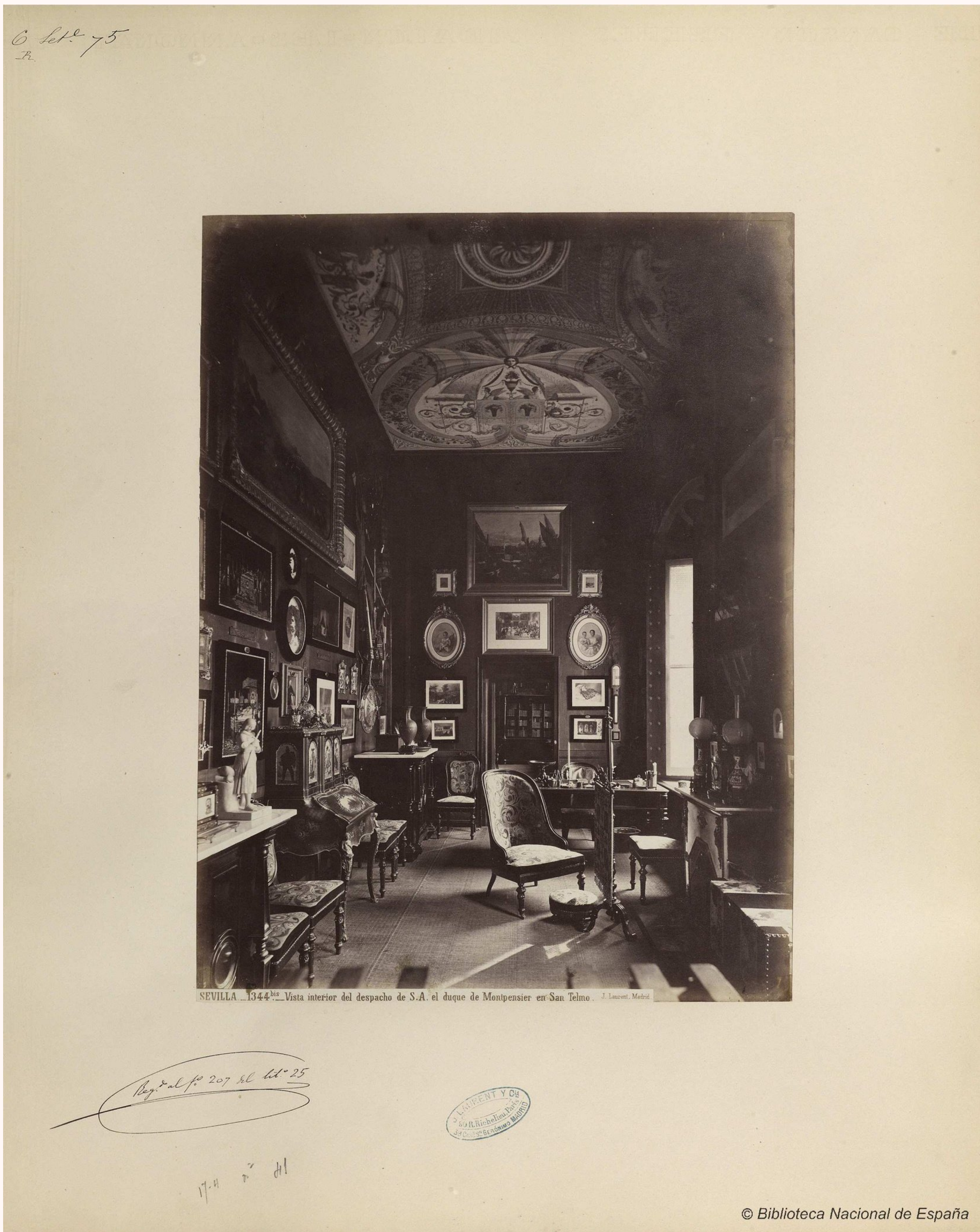
Laurent, J. Sevilla. Vista interior del despacho de S.A. el duque de Montpensier en San Telmo. 1870?. Biblioteca Nacional de España, Dibujos, grabados y fotografías.

Los principales coleccionistas en la Sevilla del siglo XIX eran el Deán López Cepero, los hermanos Bravo, el Conde del Águila, y, muy por encima de todos, el Duque de Montpensier. "La galería artística que los duques de Montpensier reunieron en Sevilla desde su llegada a la capital hispalense en 1848, hasta 1890, año del fallecimiento de don Antonio de Orleans, puede considerarse entre las mejores y más ricas de la España del siglo XIX" (RODRÍGUEZ REBOLLO, p. 21).