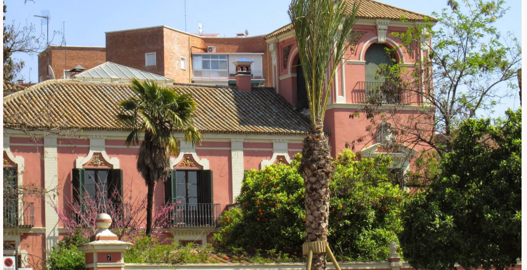
Derecha: chalet "Nuestra Señora de los Reyes" en Sevilla.

La importancia de esta colección radica tanto en el volumen y calidad de las piezas, como en su procedencia, al venir muchas de ellas directamente de las colecciones reales de Francia y España y, especialmente con la reunida por los duques de Montpensier en el Palacio de San Telmo de Sevilla.