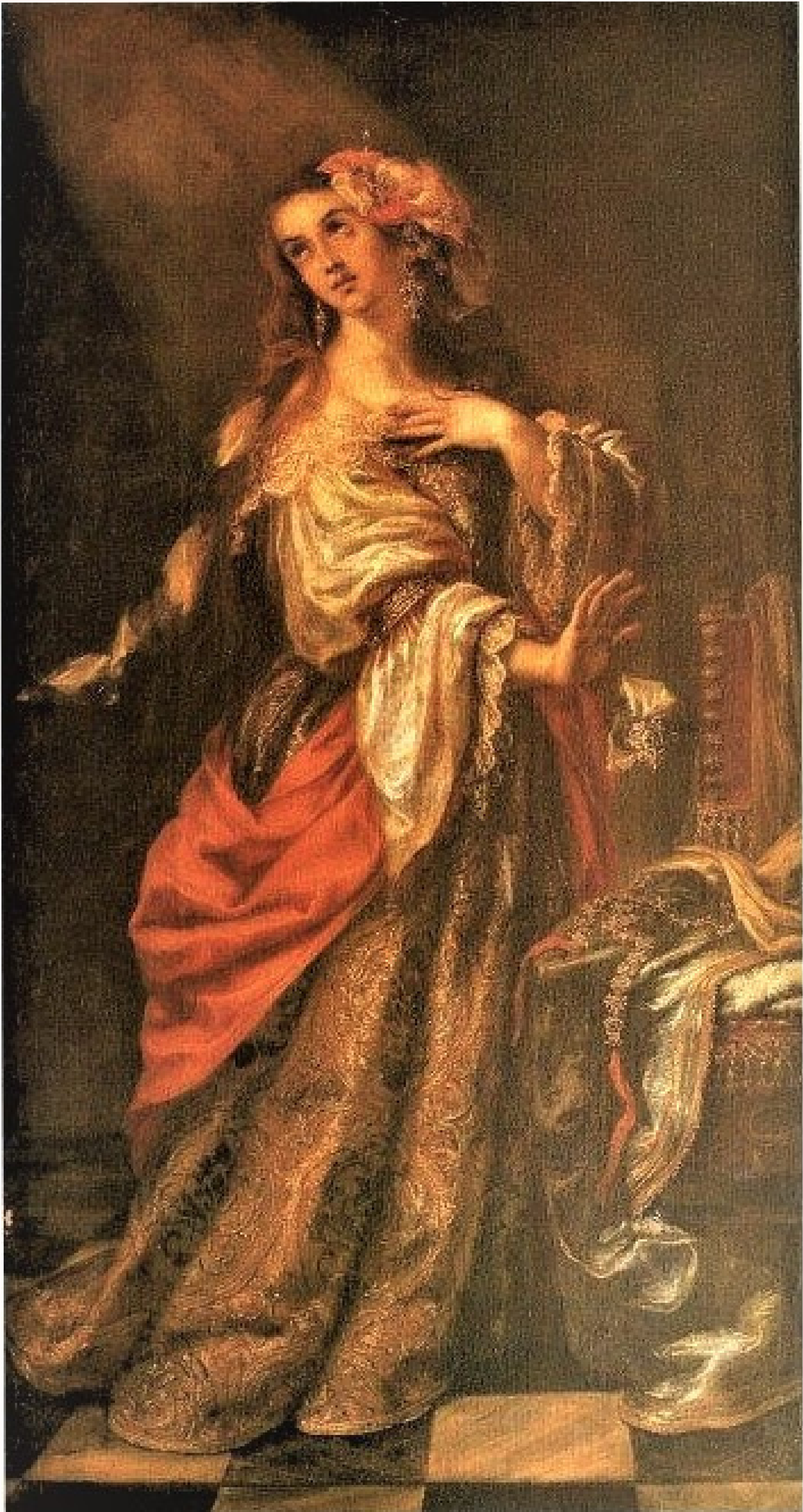
La Magdalena arrepentida (Valdés Leal, hacia 1660-1665). Óleo sobre lienzo. Colección particular.