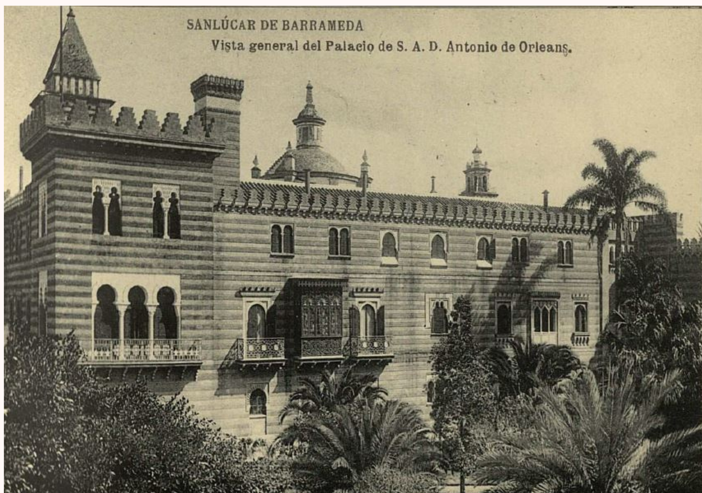
Fototipia Hauser y Menet, Madrid. 1905?. Sanlúcar de Barrameda. Vista General del Palacio de S.A.D. Antonio de Orleans. Biblioteca Nacional de España, Dibujos, grabados y fotografías, 17/TP/79 .

En la última década del siglo XIX, las muertes del duque de Montpensier (1890) y de su mujer, la infanta María Luisa Fernanda de Borbón (1897), suponen un momento clave para la continuidad de la colección, máxime cuando las piezas más importantes debieron salir del Palacio de San Telmo (donado al Arzobispado de Sevilla), que era la principal ubicación de la colección, junto a las residencias de Castilleja de la Cuesta (Sevilla) y Sanlúcar de Barrameda (Cádiz). La "carta particional", es el documento notarial de 1892 que contiene el inventario de todos los bienes del Duque, fue publicado por Rodríguez Rebolledo y resulta fundamental para conocer el comienzo de la fragmentación de la colección. La mayor parte de los bienes pasaron a manos de la hija de los duques, María Isabel de Orleans y Borbón (1848-1919), Condesa de París, y, a su vez, pasaron luego a la hija de ésta, la infanta Luisa de Orleans (1882-1958).