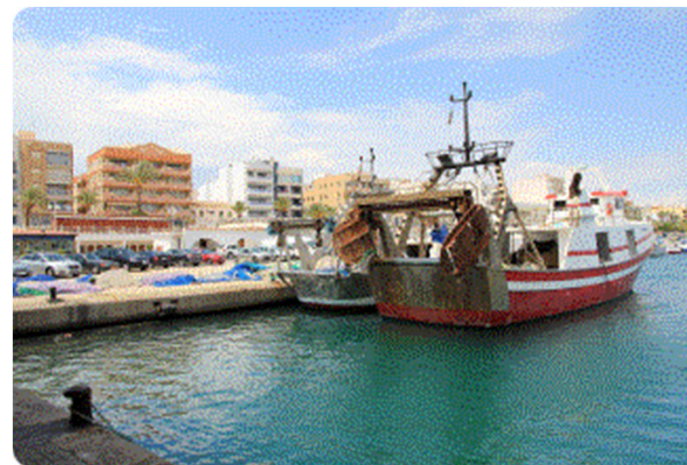
ANTIGÜEDAD DE LA FLOTA PESQUERA OPERATIVA. AÑO 2016