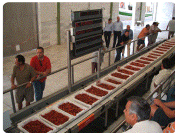
EMPLEO DIRECTO. AÑO 2016