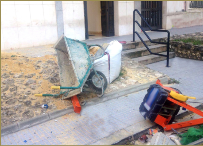
Disposición de los equipos tras la materialización del accidente por caída desde el 4° piso