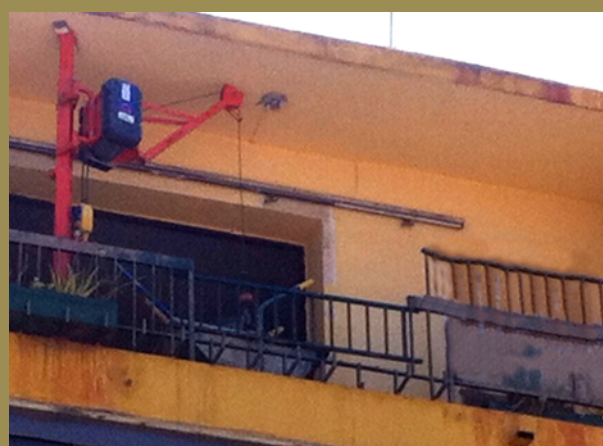
Fotografía tomada antes del accidente con el equipo elevador instalado en la terraza

La barandilla de la terraza la cortaron para el desescombro y el hueco lo taparon con uno de los tramos retirados; pero sin solidez ni altura suficiente.