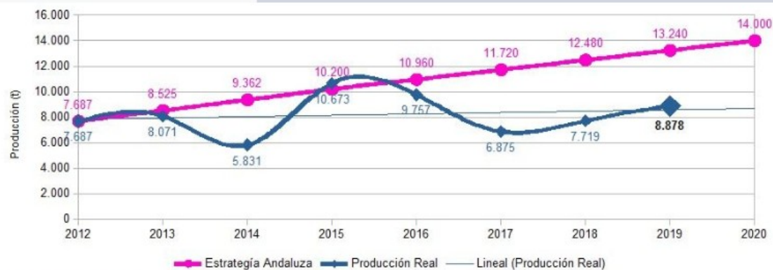
Evolución de la producción y previsión 2019