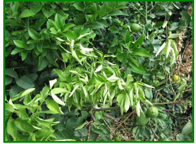
Figura 9. Síntomas, hojas cloróticas y marchitamiento de ramas.