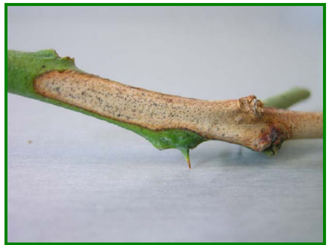
Figura 7. Síntomas, rama de color gris cubierta de picnidios.