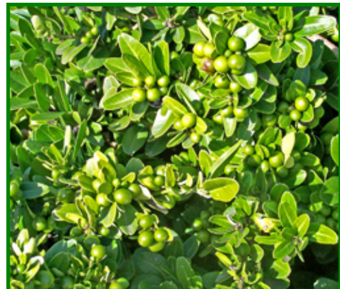
Figura 5. Género Severinia