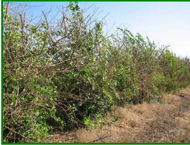
Figura 8. Síntomas, marchitez repentina de ramas.