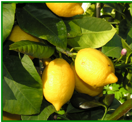
Figura 4. Género Citrus

El bergamoto, algunos mandarinos, tangelos y tangores son bastante vulnerables. La infección en pomelo y naranjo amargo es rara y no es grave por lo general. Entre los patrones susceptibles se encuentra el limón rugoso, limetta, Macrophylla , naranjo amargo y citranges Troyer y Carrizo.