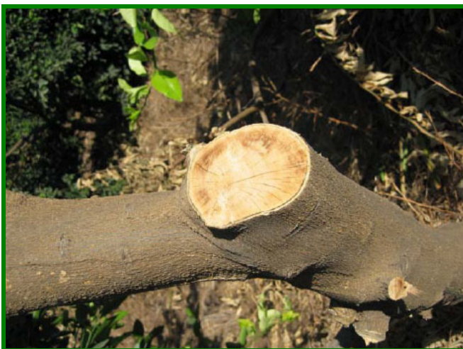
Figura 6. Síntomas, color naranja-salmón en xilema.

En adición a la forma más común del mal seco de los cítricos, se pueden distinguir dos formas diferentes de la enfermedad: " Mal fulminante " que es una forma fatal y rápida de la enfermedad, aparentemente debida a una infección radicular (Figura 8); y " Mal nero " que es consecuencia de una infección crónica del árbol que conduce al pardeado del corazón de la madera.