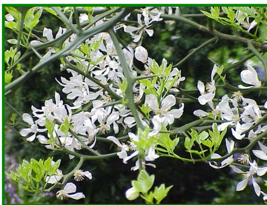
Figura 2. Género Poncirus