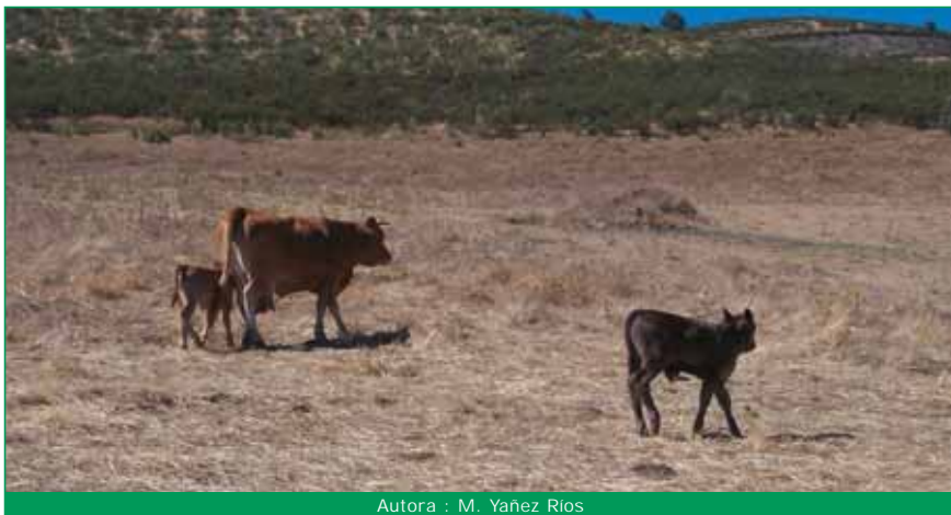
Autora : M. Yañez Ríos

Los productos obtenidos de una alimentación basada en pastos son de la máxima calidad.