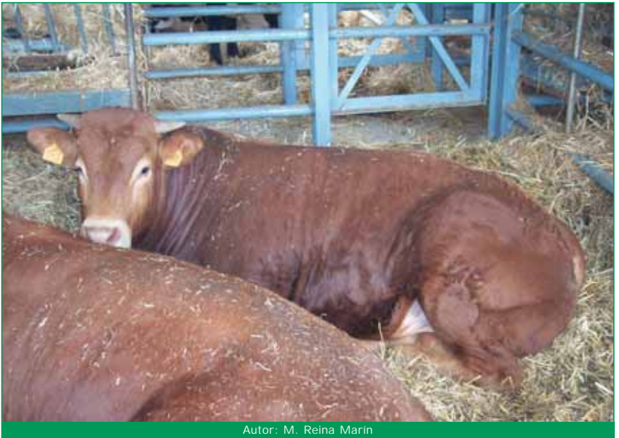
Autor: M. Reina Marín

En la estabulación temporal de los animales, se han de dar condiciones de bienestar animal.