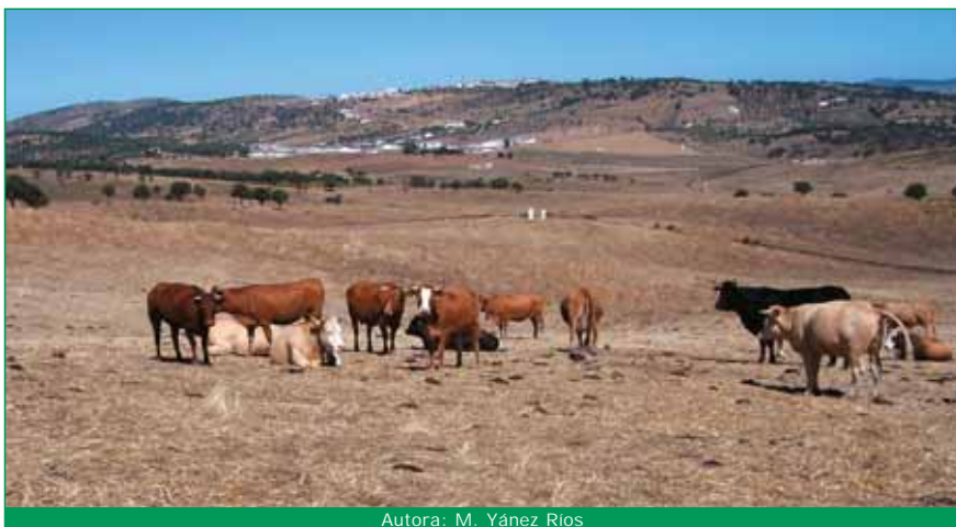
Autora: M. Yáñez Ríos

Los animales que se encuentran en la explotación puede ser la base partida de una finca ecológica.