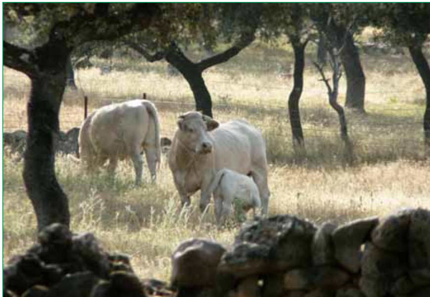
Autor: J. Quintano Sánchez

En Andalucía, la ganadería bovina para la producción de carne se desarrolla principalmente en condiciones de extensividad, y es por ello que se da una situación inmejorable que favorece la transición hacia la Ganadería Ecológica, colocándose el sistema productivo extensivo en una posición privilegiada para poder practicar este método de producción.