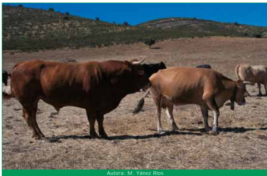
Autora: M. Yáñez Ríos

Cuando se introduzcan animales para reponer el rebaño, estos deberán ser razas puras, y a ser posible, razas autóctonas.