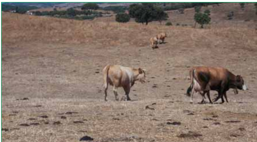
Autora: M. Yáñez Ríos

El majadeo de los animales ayuda a la fertilización de las parcelas de la finca.