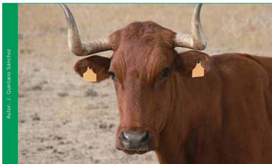
Autor: J. Quintano Sánchez

Hay que tener en cuenta que si un animal o grupo de animales recibieran más de tres tratamientos con productos de síntesis química al año, los productos obtenidos de ellos no podrán considerarse como ecológicos hasta que vuelvan a pasar el periodo de conversión.