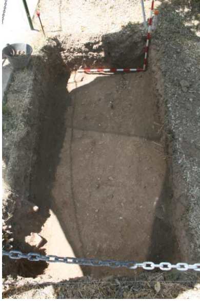
Detalle del rebaje manual en cata 4.

A 0.80 metros de profundidad de la cota inicial se detecta una inhumación individual en féretro (UE 2), en sentido N-S, en el sector Sur de la cata, en sentido E-W, se localiza otra inhumación en féretro (UE 3), a 1,00 metro de profundidad, estos sujetos no presentan evidencias de muerte violenta, por lo tanto, se procede a su exhumación para continuar el rebaje manual.