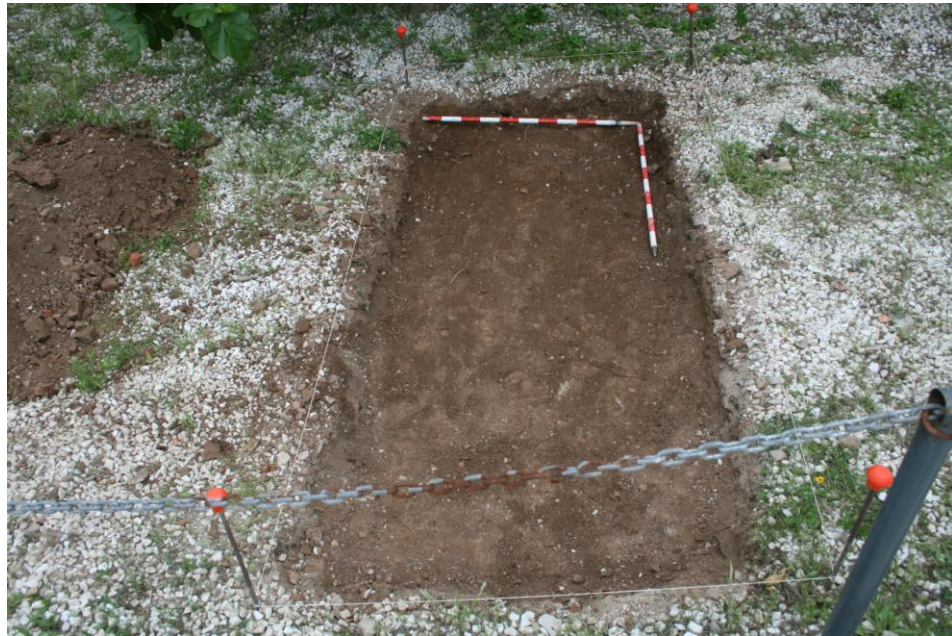
Foto. Primer rebaje manual en la cata 3.