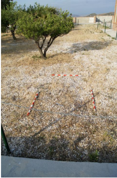
Foto inicio de la cata 1.

Dimensiones: 3 x 1,5 metros, es la cata que se sitúa más al oeste.