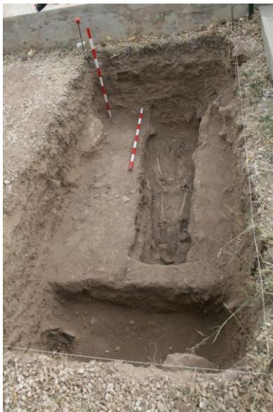
Inhumaciones en féretros en la cata 4.

A 0.80 metros de profundidad de la cota inicial se detecta una inhumación individual en féretro (UE 2), en sentido N-S, en el sector Sur de la cata, en sentido E-W, se localiza otra inhumación en féretro (UE 3), a 1,00 metro de profundidad, estos sujetos no presentan evidencias de muerte violenta, por lo tanto, se procede a su exhumación para continuar el rebaje manual.