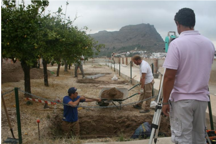
Foto detalle de trabajo; en la cata 4 y levantamiento topográfico.

A la profundidad de 1,50 metros no se detectan indicios de la fosa, por lo tanto, la longitud de la fosa es inferior a 5,50 metros. En esta cata, se localiza una estructura muraria (UE 4). Siendo este el resultado, al igual que en la cata 1, se procede a la cubrición de la cata. Se encuentran dos inhumaciones en féretro, una al sector norte de la estructura muraria, y otra al sur de la estructura, UE 5 y UE 6 respectivamente. También en el sector sureste de la cata, se encuentra una inhumación en féretro con orientación N-S, solamente se define el tren inferior (UE 7).