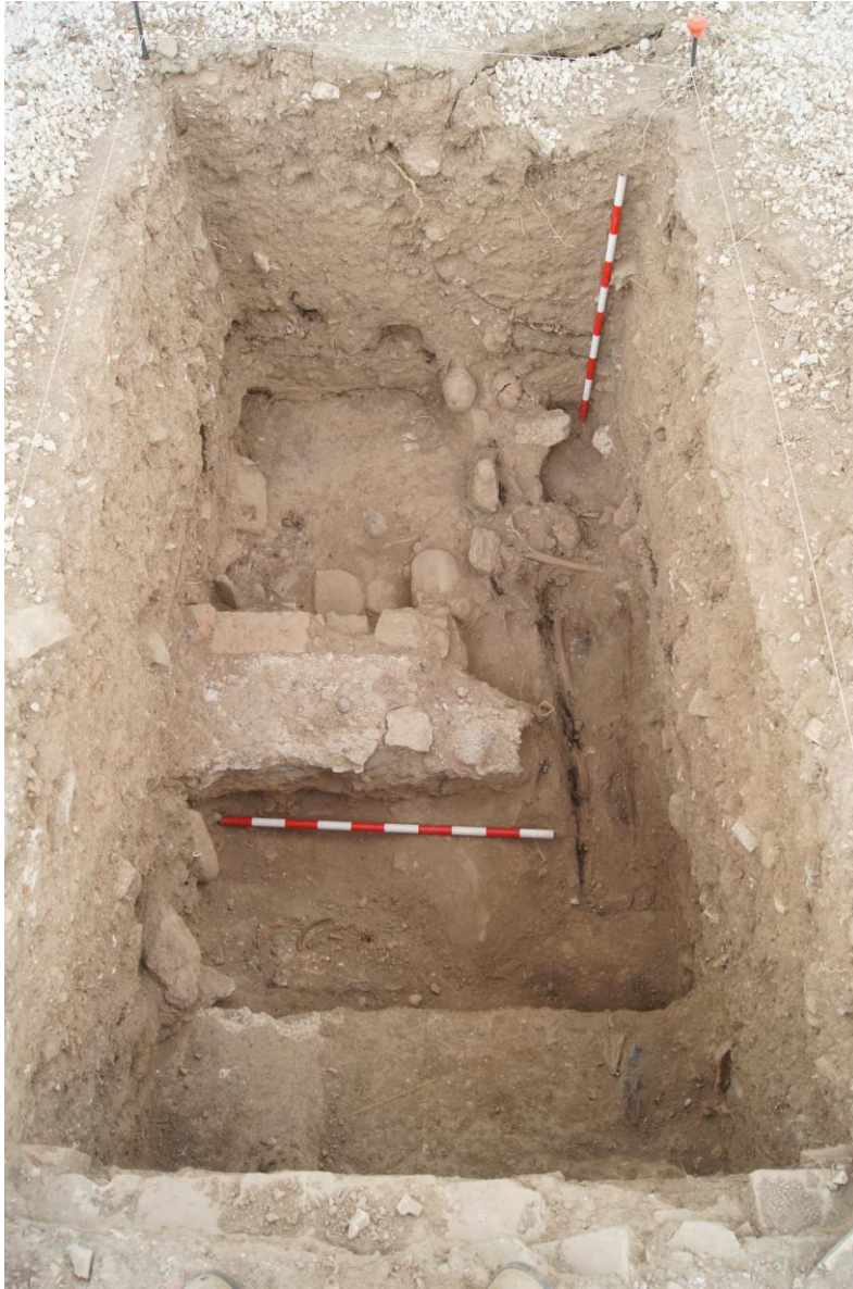
Foto final de la cata 1.