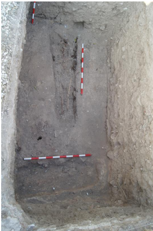
Detalle de las inhumaciones en féretro en la cata 2.