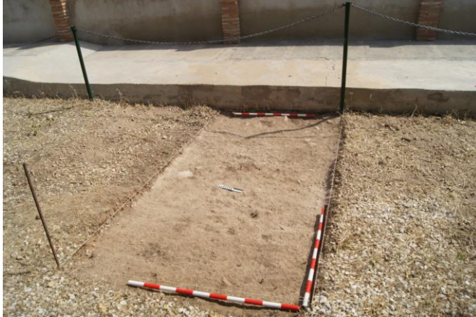
Foto inicio cata 2.

Dimensiones: 3 x 1,5 metros, esta cata se sitúa entre las catas 3 y 4