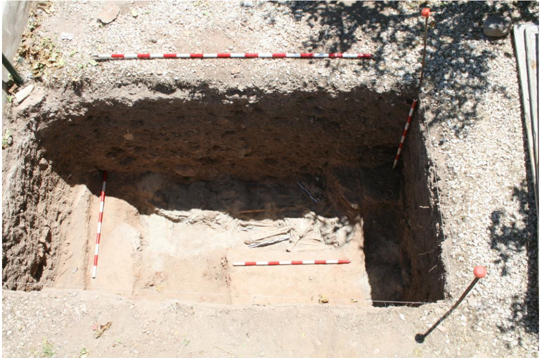
Foto final de la cata 2.

Esta cata con dimensiones de 1,5 x 3 metros y a una profundidad de 1,5 metros de la cota de la superficie se localiza un pavimento de tierra apisonada de tonalidad rojiza, posiblemente corresponda con el suelo del recinto, pero no se han detectado material mueble de interés arqueológica que pueda datar la cronología del pavimento y su momento de amortización