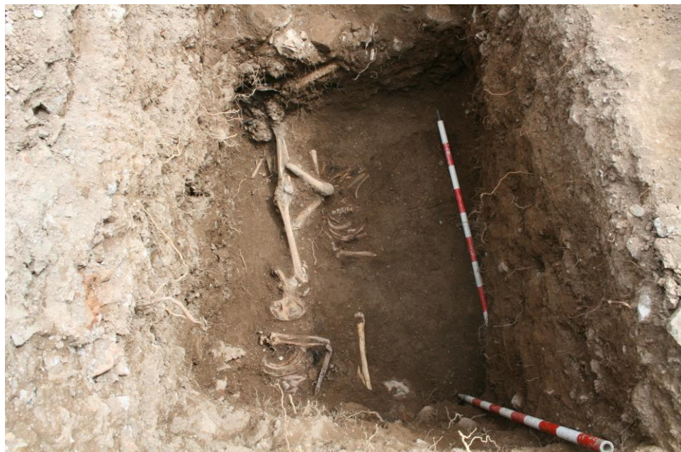
Foto. Foto final de la cata 3.