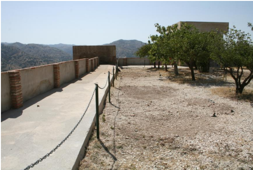
Foto. Estado final después de la cubrición de las catas.

Con respecto a los restos muebles, NO SE HAN RECOGIDO MATERIALES DE INTERÉS ARQUEOLÓGICO, por la escasez y por ser poco representativos. No son necesarias, salvo la cubrición de las estructuras de la cata 1 y 4, con hiato geotextil y la propia tierra que se extrae de las catas. En este caso de la cata 2, se cubre con tierra sobre los restos óseos humanos, de desaconseja la cubrición con grava, porque puede resultar contraproducente, y el peso podría afectar a los restos óseos humanos.