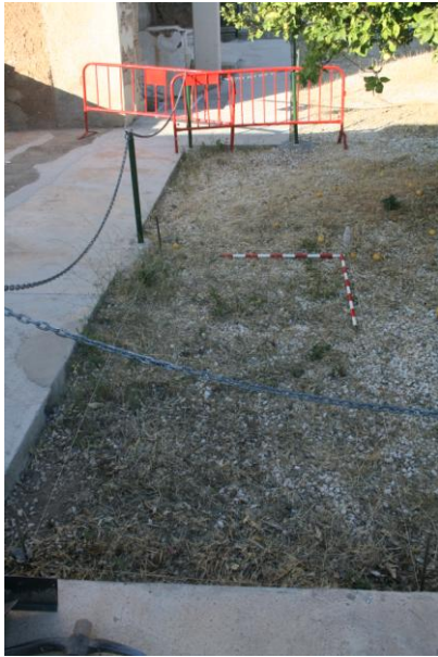
Foto inicio de la cata 4.

Dimensiones: 3 x 1,5 metros, esta cata se sitúa entre las catas 3 y 4