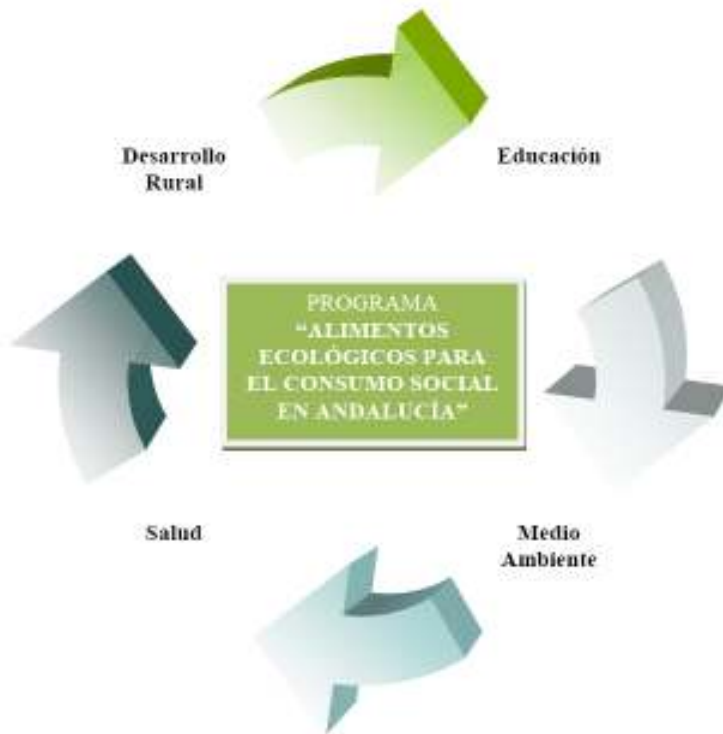
Ilustración 1: Objetivos principales del Programa de Consumo Social.

El programa se fundamenta en cuatro objetivos principales, a través de los cuáles se definen los objetivos complementarios. Estos pilares básicos son: salud, educación, medio ambiente y desarrollo rural.