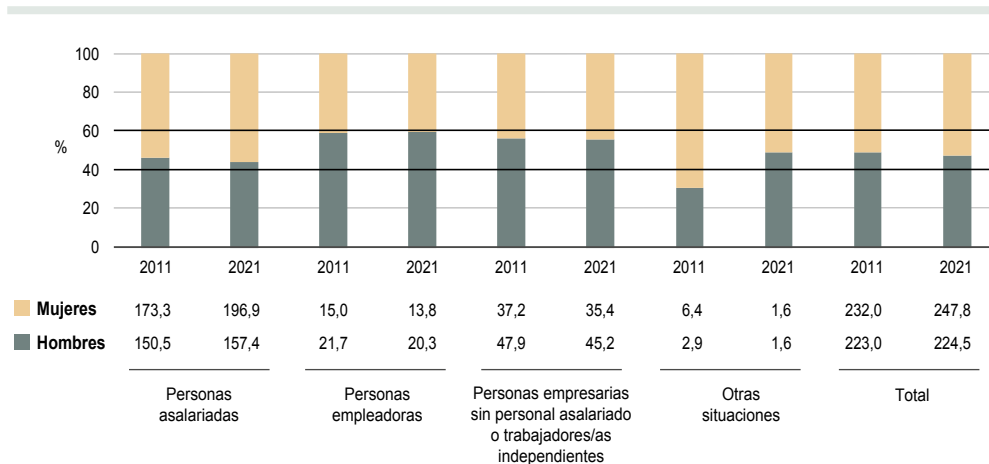
GRÁFICO 3.13.1. Personas ocupadas en el sector comercial según sexo y situación profesional en Andalucía. Años 2011 y 2021

Nota: Miles de personas, media anual. Otras situaciones incluye, entre otras, miembros de cooperativas y ayuda familiar.