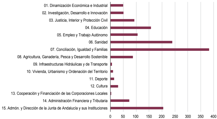
GRÁFICO 5.3. Indicadores por Políticas Presupuestarias. Presupuesto 2019

continuación, la política Administración y Dirección de la Junta de Andalucía y sus Instituciones reúne un 13,7% de indicadores (204). Educación, por su parte, cuenta con 156 indicadores (10,4%). El resto de políticas presupuestarias concentran menos del 10% de indicadores presupuestarios de género.