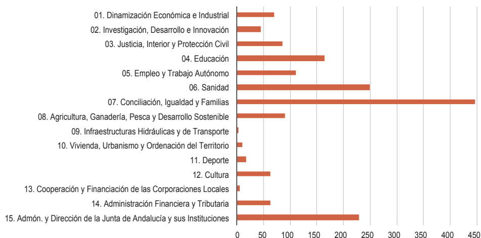
■ GRÁFICO 5.3. Indicadores por Políticas Presupuestarias. Presupuesto 2020

En esta edición del Informe de evaluación de impacto de género del Presupuesto de la Comunidad Autónoma de Andalucía para 2020 los indicadores por políticas presupuestarias estarán accesibles a través del enlace web de “Presupuesto con Perspectiva de Género”, de la Consejería de Hacienda, Industria y Energía, https://juntadeandalucia.es/organismos/haciendaindustriayenergia/areas/presupuestos/genero.html