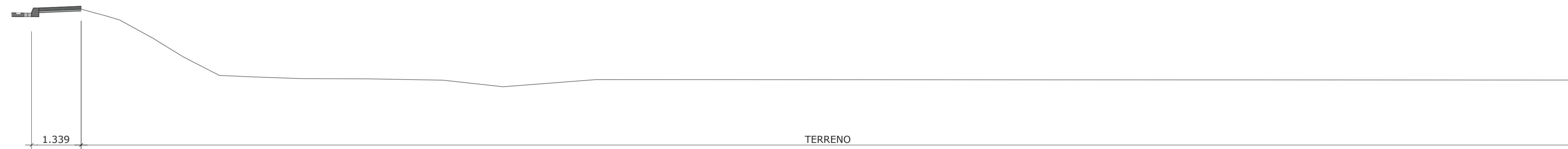
SECCIÓN 1. P.K. (0+275). SECCIÓN ACTUAL