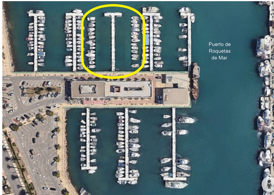
Alternativa 3 ubicación provisional embarcaciones