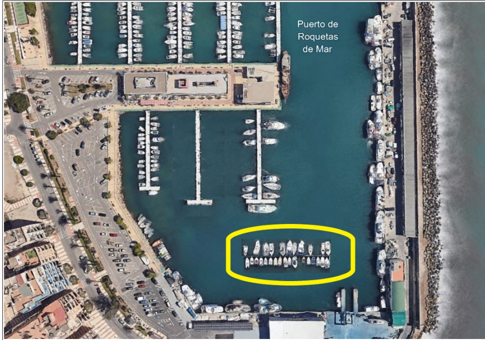
Alternativa 2 ubicación provisional embarcaciones